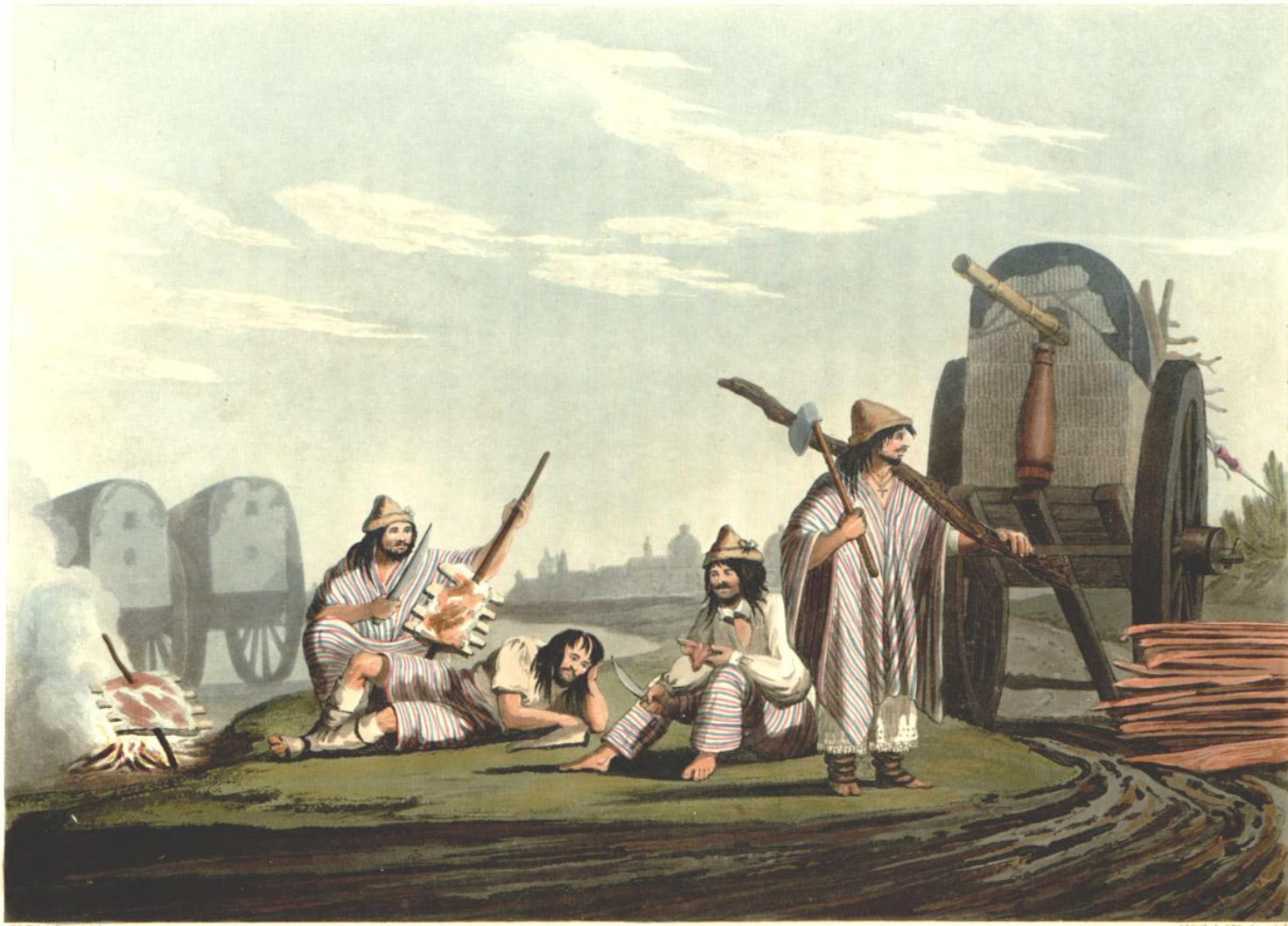
GAUCHOS (RUSTICS) OF TUCUMAN .

London, Published & sold by W. Ackermann, 10, Strand.