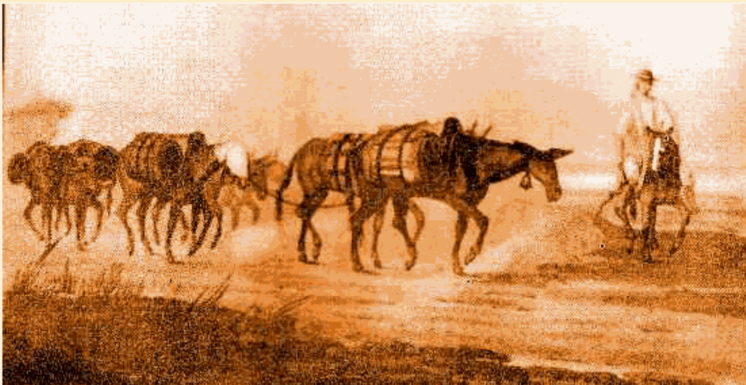
Emeric Essex Vidal , Mules en route vers Mendoza, 1816.