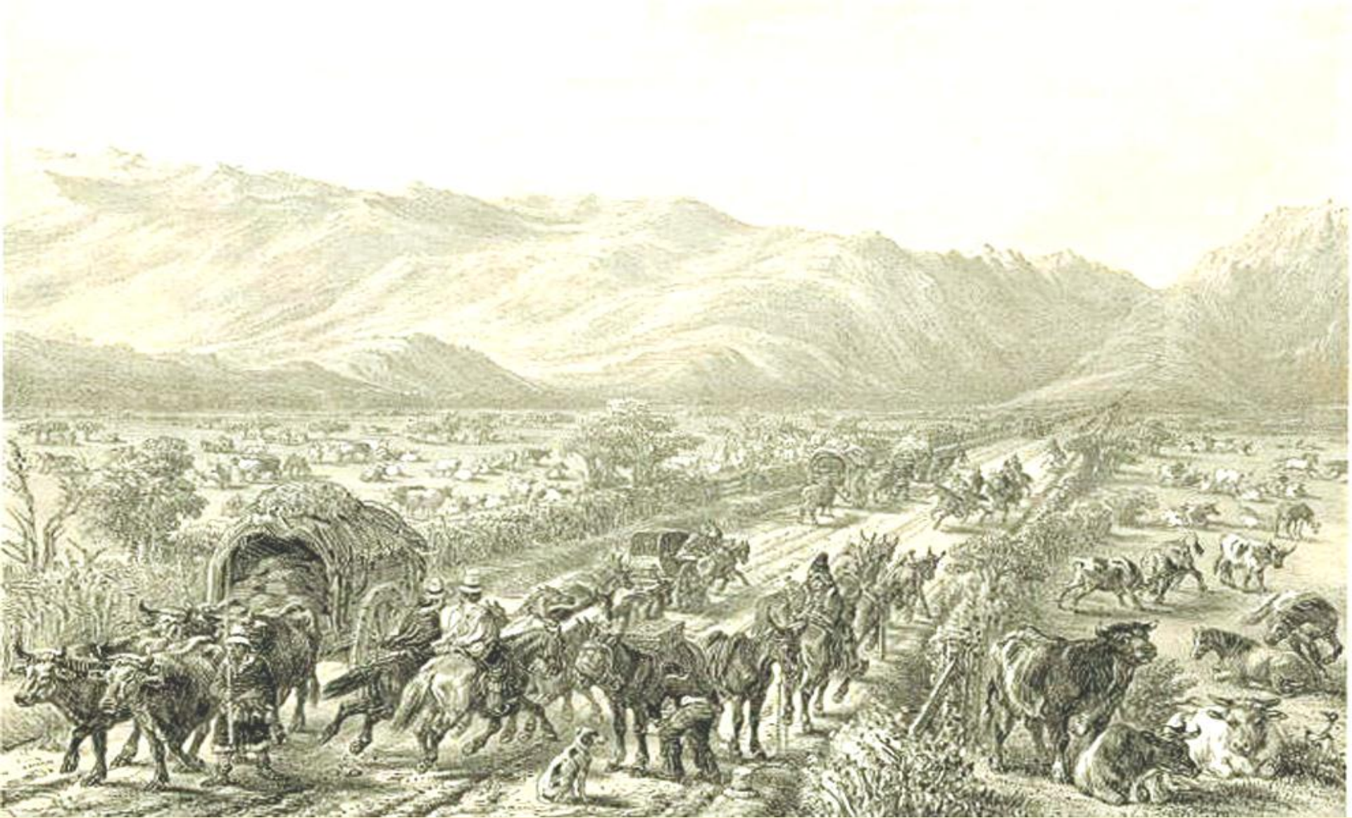
Claude Gay, Chemin de Valparaiso après 1828