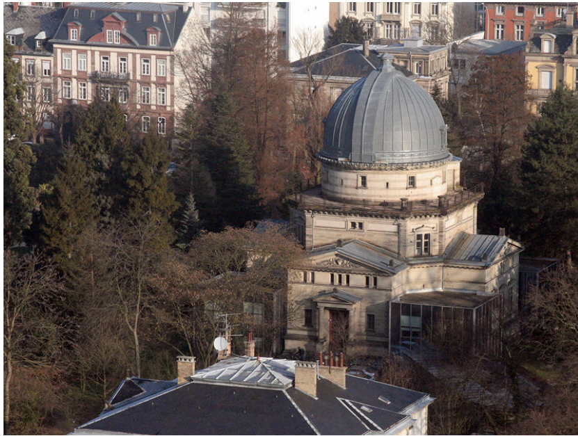
FIGURE 4 – L’observatoire de Strasbourg

Strasbourg le 2 Septembre de cette même année. En vingt-quatre heures, c’est 120 000 strasbourgeois qui sont évacués 37 . L’Université de Strasbourg et l’Observatoire se replient à Clermont-Ferrand en Novembre 1939 38 . Le directeur de l’Observatoire de Strasbourg est, depuis le premier Septembre 1930, prenant la succession d’Ernest Esclangon, l’astronome André Danjon (1890-1967) 39 . André Danjon est aussi en 1939 vice-président de l’Université de Strasbourg. Comme l’année 1914, l’année 1939 marque une coupure dans la carrière académique d’Alexandre Véronnet. A Clermont-Ferrand Alexandre Véronnet a habité au 23 rue Paul Diomède comme sa carte d’identité nous l’indique 40 .