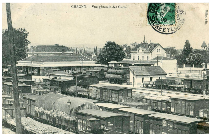
FIGURE 2 – gare de Chagny vers 1900