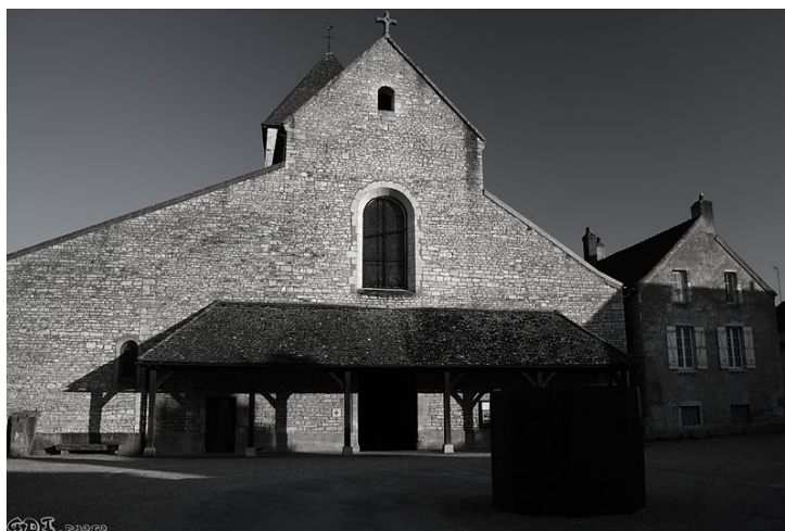
FIGURE 3 – Eglise Saint Martin de Chagny