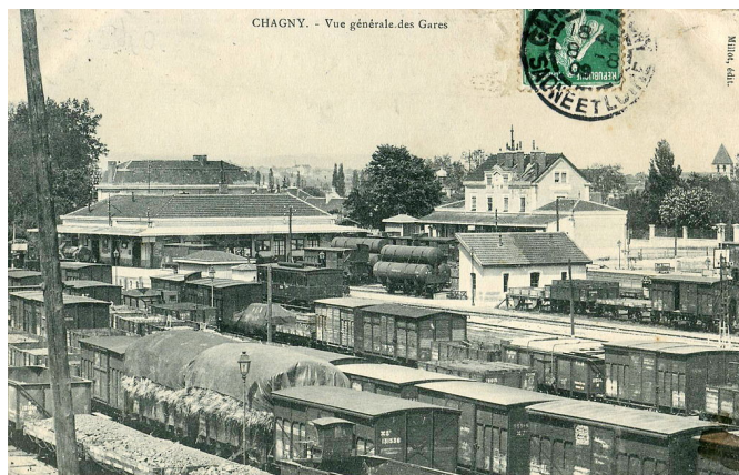
FIGURE 2 – gare de Chagny vers 1900