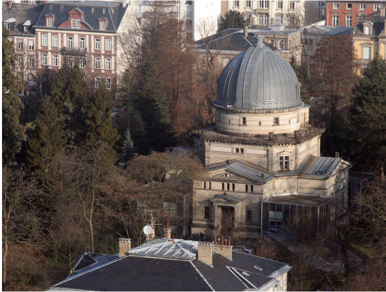
FIGURE 4 – L’observatoire de Strasbourg