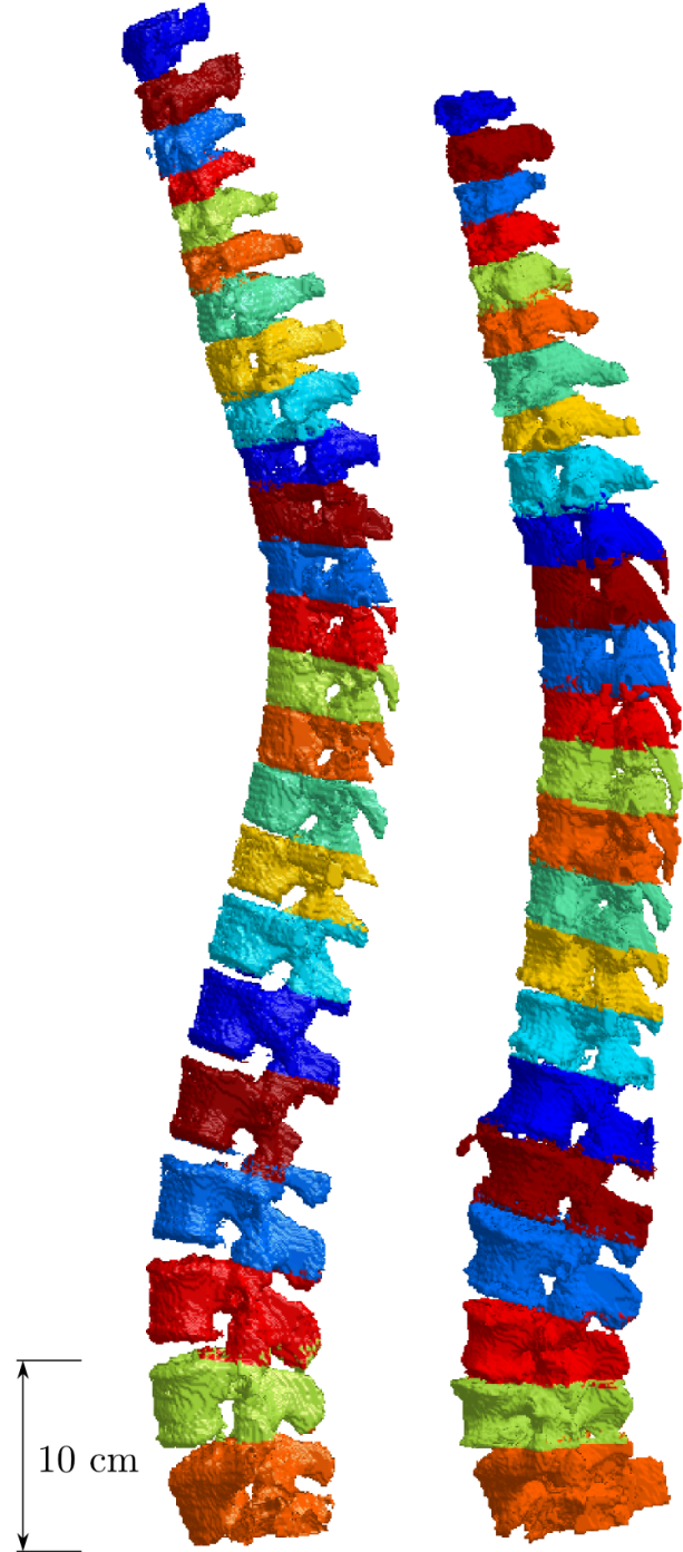
FIGURE 2 – Exemples de résultats intégrés sur la colonne vertébrale de deux patients. Les vertèbres sont séparées par le même jeu de couleur. Gauche : rachis sain. Droite : rachis arthrosique.

Paramètres : I_j = S_j \forall j, O_1 = 0, O_j = (S_{j-1} + S_j)/2 \forall j > 1, m_1 = 100 , décroissance linéaire jusqu’à m_J = 70, S_1 = 23\text{mm}, S_2 = 17\text{mm}, S_j = 11\text{mm} \forall j > 2, g est l’intervalle des valeurs de V_t, Q = 0.4 \times g, l_0 = 1300 \text{HU}, \delta = 1/|V_t|