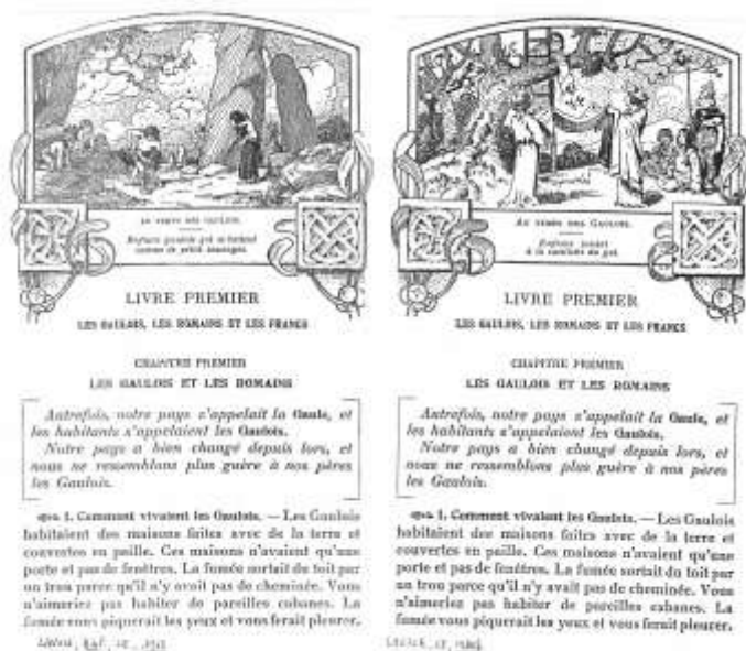
Images inaugurales du Livre I du petit Lavisse cours élémentaire « Au temps des Gaulois », 1913/1930

L'éditeur Armand Colin va en tirer les conséquences et opérer un changement de nature dans l'écriture des petits Lavisse. On le constate aussi bien dans les images qui inaugurent les grandes parties comme dans les textes des dernières leçons. Lavisse étant mort en 1922, l'éditeur, sensible à l'esprit briandiste de la fin des années 1920 – qui va bien au-delà des seuls maîtres syndiqués – modifie donc en profondeur les petits Lavisse. Pour le cours élémentaire cela se traduit par le changement des gravures d'en-tête de quatre des sept livres de l'ouvrage (représentant des scènes enfantines de jeu impliquant les petits lecteurs) lorsqu'elles étaient trop guerrières. Ces images inaugurales avaient un rôle d'identification considérable pour les enfants car elles les intégraient par le jeu à l'Histoire. Les images en général étaient au cœur de la méthode des petits Lavisse, comme Lavisse le souligne lui-même dans la première ligne de la préface de son cours élémentaire en 1913 : « Ce volume contient des récits qui encadrent des images ». Or, désormais les enfants gaulois ne « se battent plus comme des petits sauvages » (1913) mais « jouent à la cueillette du gui » (1930), de même qu'« Au temps de la Révolution », les « enfants jouant à la guerre » (1913) sont remplacés par des « enfants jouant à ramener à Paris la famille royale » (1930)