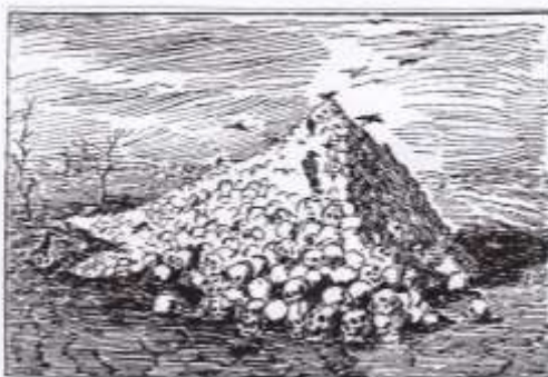
Antalotti, Issa, Eglau, Friedland, Wagram, le Massacre.