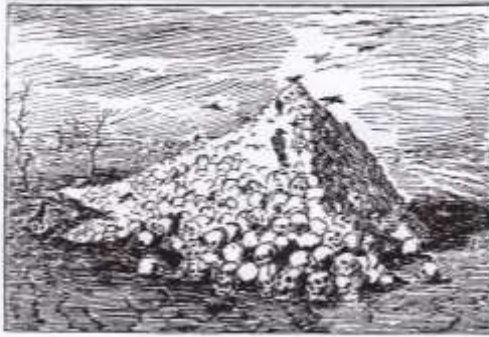
Antalotti, Issa, Eylau, Friedland, Wagram, le Massacre.