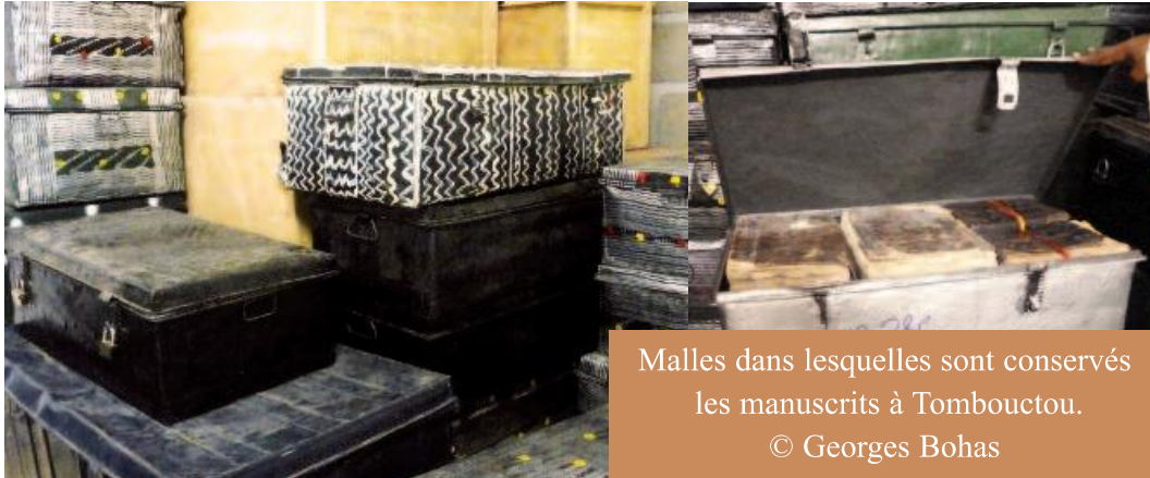
Malles dans lesquelles sont conservés les manuscrits à Tombouctou.