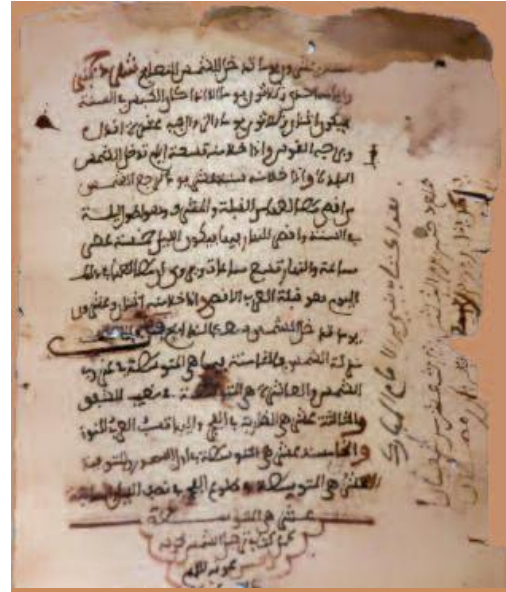
Ibn al-Bannā, Kitāb tarhīl ash-shams [Livre du déplacement du soleil]

Située sur le fleuve Niger, cette célèbre ville du Mali voit prospérer le savoir et l'enseignement à l'apogée de l'Empire des Songhaï. Pendant toute cette période correspondant grosso-modo aux XV e -XVI e siècles, l'université de Sankore et les nombreuses madrasa (écoles coraniques) de Tombouctou sont reconnues jusqu'en Égypte, au Maghreb Extrême et même en Andalus , pour la qualité de l'enseignement qui y est dispensé dans la tradition classique des pays d'Islam. En particulier, l'université de Sankore possède l'une des bibliothèques les plus importantes de cette époque, avec des centaines de milliers de manuscrits !