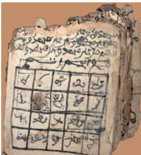
Manuscrit présentant un carré magique © Jean-Michel Djian, p.88