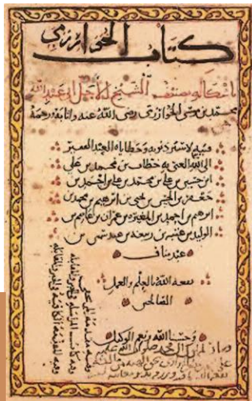
Frontispice de l'algèbre arabe d'al-Khwārizmī.

Nous connaissons aujourd'hui trois traductions latines de l'algèbre d'al-Khwārizmī avec de nombreuses copies dans plusieurs bibliothèques européennes. Elles sont toutes partielles : la partie pratique sur le calcul des héritages intimement liée aux règles coraniques n'est traduite dans aucune des versions latines connues ; elles n'est pas transférable aux usages chrétiens.