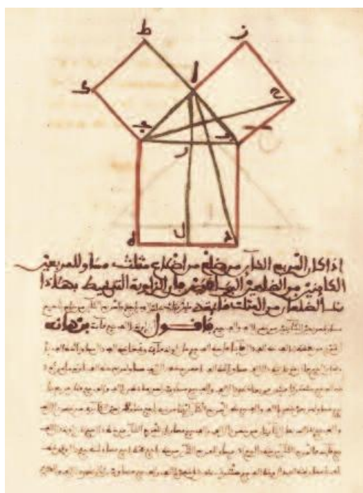
Manuscrit arabe des Éléments d'Euclide présentant le théorème de Pythagore.

Pour se faire une idée de l'ampleur des traductions, il suffirait d'étudier la liste des traductions réalisées par Gérard de Crémone (mort en 1187) qui nous est parvenue grâce à l'éloge que ses étudiants ont rédigé à sa mort. On y dénombre pas moins de soixante et onze textes parmi lesquels, pour les mathématiques, les Éléments et les Données d'Euclide, De la mesure du cercle d'Archimède, l'Almageste de Ptolémée, le commentaire aux Éléments d'an-Nayrizī, le livre de géométrie des frères Banū Mūsā, l'algèbre d'al-Khwārizmī. La charge incombe ensuite aux copistes de les reproduire pour en assurer la pérennité et la circulation dans toute l'Europe.