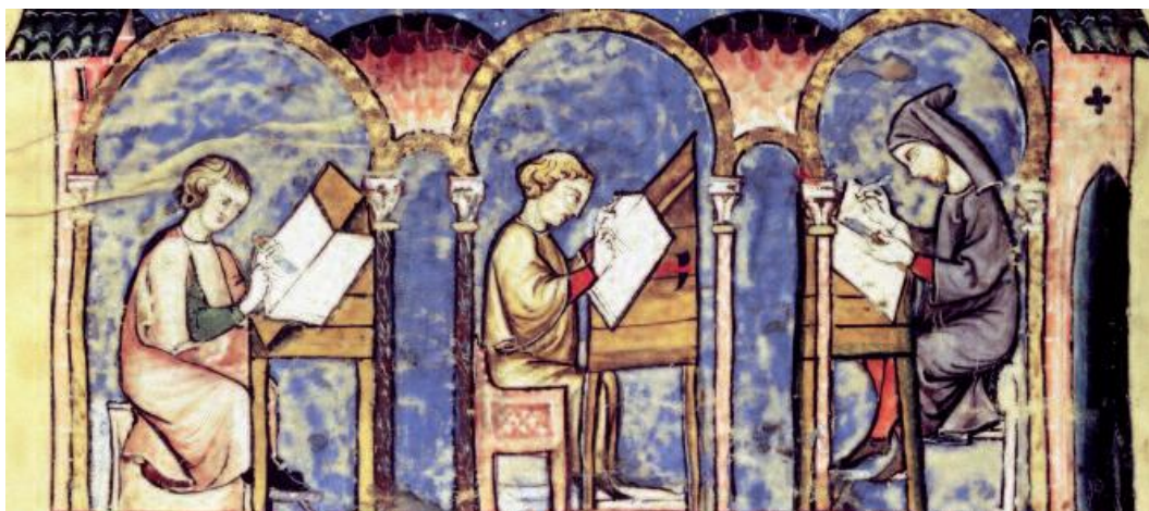
Atelier de copistes en Espagne