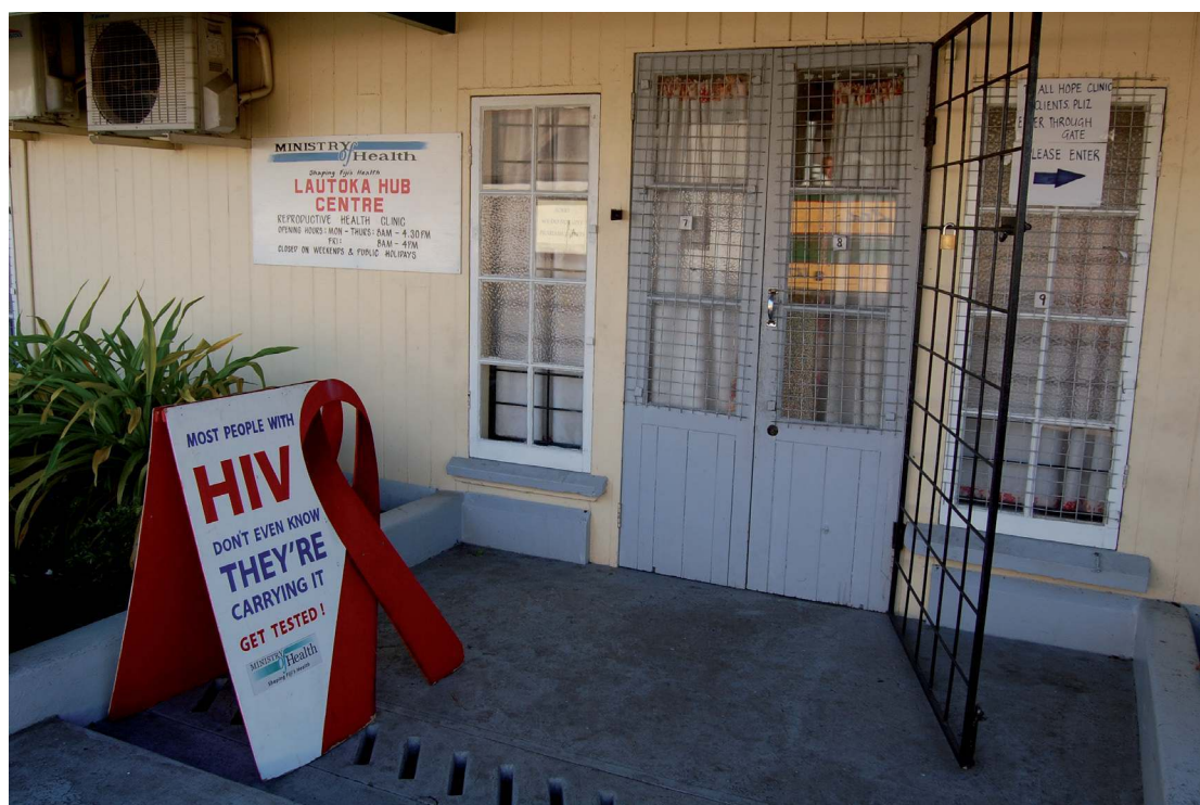
PHOTO 2. – Panneau orné d'un ruban rouge, symbole international de la lutte contre le sida, situé à l'entrée de la clinique de suivi et de traitement du VIH de Lautoka

La littérature sur le VIH/sida a abondamment souligné l'impact de la stigmatisation et de la discrimination liées au VIH sur la qualité de vie et le bien-être des personnes atteintes ainsi que sur leur capacité d'accéder aux soins (voir entre autres Aggleton et al. , 2005). Aux Fidji, la crainte des personnes séropositives de voir leur condition connue ou soupçonnée, et la stigmatisation et l'exclusion qui pourraient en résulter, prend une dimension particulière en raison de la valeur fondamentale accordée à la réputation dans l'univers moral fidjien. Lors des entretiens, le terme le plus fréquemment employé par les personnes vivant avec le VIH pour parler de leur réaction à l'annonce de leur séropositivité était le terme madua , un terme polysémique recouvrant des émotions et des attitudes telles que l'humilité, la timidité et l'embarras, mais traduit le plus couramment, en référence au VIH, par la honte et la culpabilité (sur le concept de madua voir notamment Arno, 1990 et Toren, 1990). En raison de son association avec le « péché » et l'« immoralité », le VIH est en effet perçu, aux îles Fidji, comme entachant la réputation de la personne directement affectée par l'infection, mais également celle de sa famille, de son lignage, de son clan et de son village, qui sont considérés comme responsables de l'éducation et, par conséquent, des actions de leurs membres. Ce sentiment de donner un « mauvais nom » à leur famille, à leur lignage et à leurs autres groupes