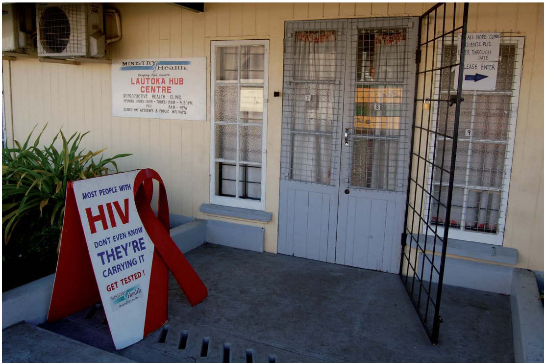
PHOTO 2. – Panneau orné d'un ruban rouge, symbole international de la lutte contre le sida, situé à l'entrée de la clinique de suivi et de traitement du VIH de Lautoka

La littérature sur le VIH/sida a abondamment souligné l'impact de la stigmatisation et de la discrimination liées au VIH sur la qualité de vie et le bien-être des personnes atteintes ainsi que sur leur capacité d'accéder aux soins (voir entre autres Aggleton et al. , 2005). Aux Fidji, la crainte des personnes séropositives de voir leur condition connue ou soupçonnée, et la stigmatisation et l'exclusion qui pourraient en résulter, prend une dimension particulière en raison de la valeur fondamentale accordée à la réputation dans l'univers moral fidjien. Lors des entretiens, le terme le plus fréquemment employé par les personnes vivant avec le VIH pour parler de leur réaction à l'annonce de leur séropositivité était le terme madua , un terme polysémique recouvrant des émotions et des attitudes telles que l'humilité, la timidité et l'embarras, mais traduit le plus couramment, en référence au VIH, par la honte et la culpabilité (sur le concept de madua voir notamment Arno, 1990 et Toren, 1990). En raison de son association avec le « péché » et l'« immoralité », le VIH est en effet perçu, aux îles Fidji, comme entachant la réputation de la personne directement affectée par l'infection, mais également celle de sa famille, de son lignage, de son clan et de son village, qui sont considérés comme responsables de l'éducation et, par conséquent, des actions de leurs membres. Ce sentiment de donner un « mauvais nom » à leur famille, à leur lignage et à leurs autres groupes