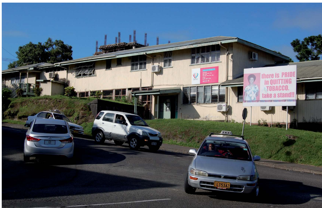
PHOTO 1. – Clinique de suivi et de traitement du VIH de Suva (cliché de l'auteur, 2013)

semaines ou de quelques mois à peine. Parmi les 15 personnes qui étaient sous antirétroviraux, 13 rapportaient également avoir déjà interrompu leur traitement pour des périodes allant de quelques semaines à plusieurs mois, voire plusieurs années consécutives. Un peu plus du quart d'entre elles rapportaient même avoir cessé leur traitement à plus d'une reprise.