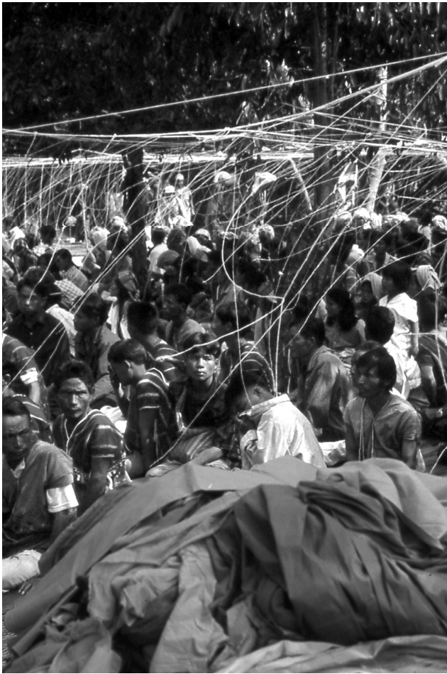
Figure 2. Réseau de fils de coton (sai sin) quadrillant l'espace au-dessus de l'aire rituelle consacrée et au-dessus de l'assistance

forêts au-delà de leurs différences religieuses. Ces symboles relativisaient aussi la primauté du langage bouddhique dans le rituel, faisant ressortir les innovations que les Karen, en raison de leur diversité religieuse, apportent à son exécution.