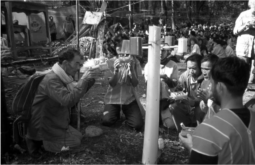
Figure 5. Officiants karen autour de l'autel (tao thang si) dédié aux esprits du sol et aux divinités gardiennes des quatre points cardinaux

la cérémonie se poursuit par des discours de remerciements de la part des personnalités officielles invitées, dont le représentant provincial du Département royal des forêts. Chacun rappela la nécessité de protéger la forêt. Puis, en prélude à la récitation de mantras par des moines bouddhistes, des intervenants étrangers se succédèrent pour réciter des textes religieux en différentes langues et réaffirmer la dimension œcuménique du rituel, déjà mise en valeur lors de la première conférence.