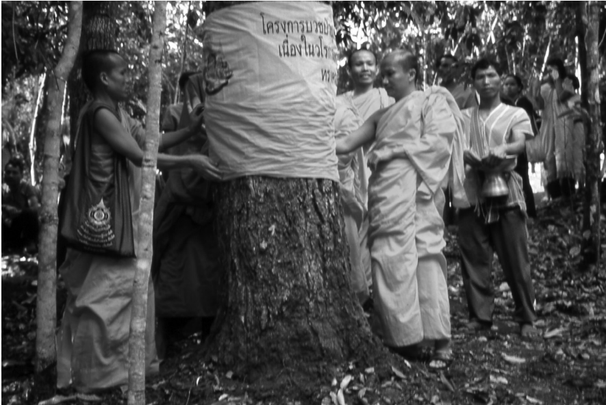
Figure 7. Ligature desarbres