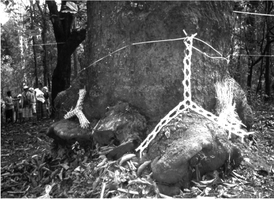
Figure 3. « Œil de faucon » (talaeo)

bananier et de « drapeaux » de papier découpé. Divers éléments attachés à chacun des étais — quatre paquets de cent huit « étais de vie » miniatures, échelles décorées de feuilles de thé, pousses de canne à sucre et d'aréquier, noix de coco, ainsi que diverses offrandes de tabac, de bétel et d'eau lustrale contenue dans des pots en terre — venaient renforcer leur fonction symbolique de soutien d'une vie prospère. Aux points fondamentaux de la structure (centre de la base, sommet, quatre points cardinaux), étaient disposés six réceptacles d'offrandes végétales surmontés de bougies, lesquels étaient destinés au rite animiste qui inaugura la cérémonie. Ce prélude fut effectué par des officiants pga k' nyau, qui figuraient comme acteurs centraux de l'événement aux côtés des moines et des représentants de l'État. Ces personnages sont désignés localement comme « médiums-guérisseurs » ( mophi en thaï, s'ra en sgaw), mais certains participants anglophones les appelèrent « chamans », catégorie évocatrice pour les Occidentaux présents. Spécialistes des rites d'exorcisme, ils connaissent un certain nombre d'incantations empruntées aux moines bouddhistes thaïs, shan et birmans, et considérées comme efficaces sur les esprits