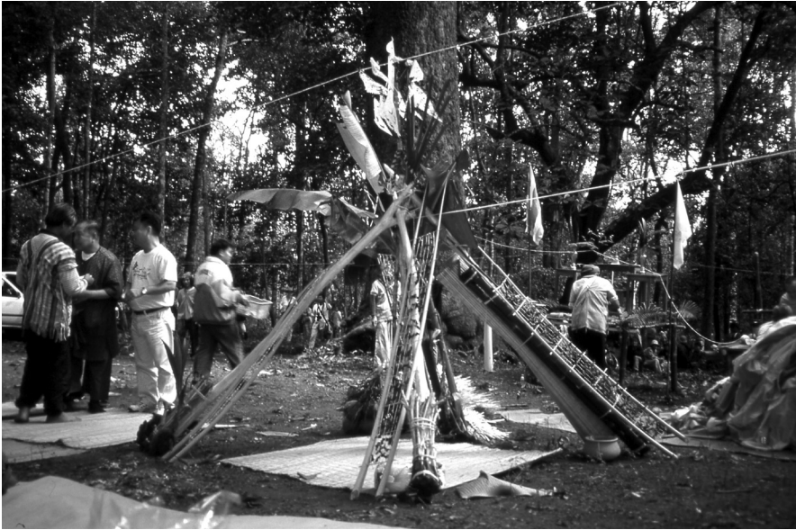
Figure 1. Faisceau d'« étais devie » (sum mai khamchata) — accessoire essentiel de toute « cérémonie de prolongement de la vie » (phithi suep chata)