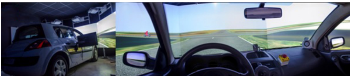
Figure 1: A gauche, le simulateur de conduite vu de l'extérieur avec les 3 rétroprojecteurs et les trois écrans. A droite, le point de vue des participants à l'intérieur de l'habitacle. La scène visuelle est projetée devant le véhicule et apparaît également sur les rétroviseurs.

14 participants ont réalisé l'expérience dans un simulateur de conduite automobile (figure 1). Ils observaient une scène visuelle dans laquelle ils se déplaçaient passivement en direction d'une intersection et devaient observer un véhicule approcher sur une route transversale à la leur (figure 1 à droite). Avant que le véhicule observé atteigne l'intersection, la scène visuelle disparaissait (i.e., paradigme de disparition). Les participants devaient appuyer sur un bouton pour indiquer à quel moment ils pensaient que le véhicule aurait franchi l'intersection. Les conducteurs étaient amenés à croiser deux types de véhicules différents (i.e., voiture ou motocyclette) ayant des dimensions identiques. Cette particularité permettait d'analyser de manière spécifique l'incidence du type de véhicules croisés sur la perception des automobilistes indépendamment de leur taille. Les véhicules croisés pouvaient également être de taille normale ou de grande taille (x2). Enfin, pour qu'il n'y ait pas un effet d'habituation le véhicule observé pouvait franchir l'intersection 1 s, 2 s ou 3 s après la disparition de la scène visuelle.