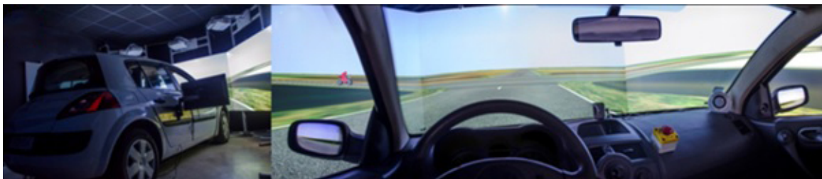
Figure 1: A gauche, le simulateur de conduite vu de l'extérieur avec les 3 rétroprojecteurs et les trois écrans. A droite, le point de vue des participants à l'intérieur de l'habitacle. La scène visuelle est projetée devant le véhicule et apparaît également sur les rétroviseurs.

14 participants ont réalisé l'expérience dans un simulateur de conduite automobile (figure 1). Ils observaient une scène visuelle dans laquelle ils se déplaçaient passivement en direction d'une intersection et devaient observer un véhicule approcher sur une route transversale à la leur (figure 1 à droite). Avant que le véhicule observé atteigne l'intersection, la scène visuelle disparaissait (i.e., paradigme de disparition). Les participants devaient appuyer sur un bouton pour indiquer à quel moment ils pensaient que le véhicule aurait franchi l'intersection. Les conducteurs étaient amenés à croiser deux types de véhicules différents (i.e., voiture ou motocyclette) ayant des dimensions identiques. Cette particularité permettait d'analyser de manière spécifique l'incidence du type de véhicules croisés sur la perception des automobilistes indépendamment de leur taille. Les véhicules croisés pouvaient également être de taille normale ou de grande taille (x2). Enfin, pour qu'il n'y ait pas un effet d'habituation le véhicule observé pouvait franchir l'intersection 1 s, 2 s ou 3 s après la disparition de la scène visuelle.