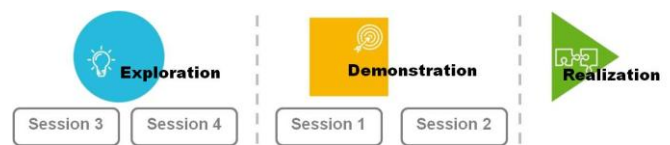
Figure 3 : Positionnement des sessions dans le Processus Innovation

Initialement ce processus est défini pour des projets se plaçant dans l'étape Exploratoire de la démarche d'innovation de l'entreprise. A ce jour, nous avons organisé et observé quatre sessions, pour quatre projets différents, jusqu'à la troisième phase du processus décrit ci-dessus : la phase de matérialisation. De manière intéressante le positionnement de ces sessions dans le processus d'innovation est différent (cf. figure 3), en effet parmi ces quatre sessions, deux d'entre elles se placent dans l'étape Exploration et les deux autres font parties de l'étape Démonstration. En fonction du positionnement de la session dans le processus d'innovation, la nature de l'innovation produite est différente. En effet pour les sessions placées dans l'étape Exploration, l'innovation se rapproche de l'innovation de rupture. La session a comme particularité d'être très amont, il n'y a alors pas ou peu de données existantes. Pour les sessions situées dans l'étape Démonstration, l'innovation se rapproche de l'innovation incrémentale car c'est principalement de l'amélioration de produits qui est faite.