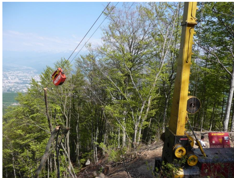
Figure 2 : démonstration de coupe à câble dans le Vercors en 2011

La méthanisation engendre un débat entre les acteurs à la fois de l'énergie, de la forêt mais aussi de l'agriculture : la Chambre d'agriculture de l'Isère est présente au Comité de programme et souhaite fortement s'investir dans une réflexion à venir sur l'utilisation de la biomasse agricole, fondée notamment sur le scénario Négawatt.