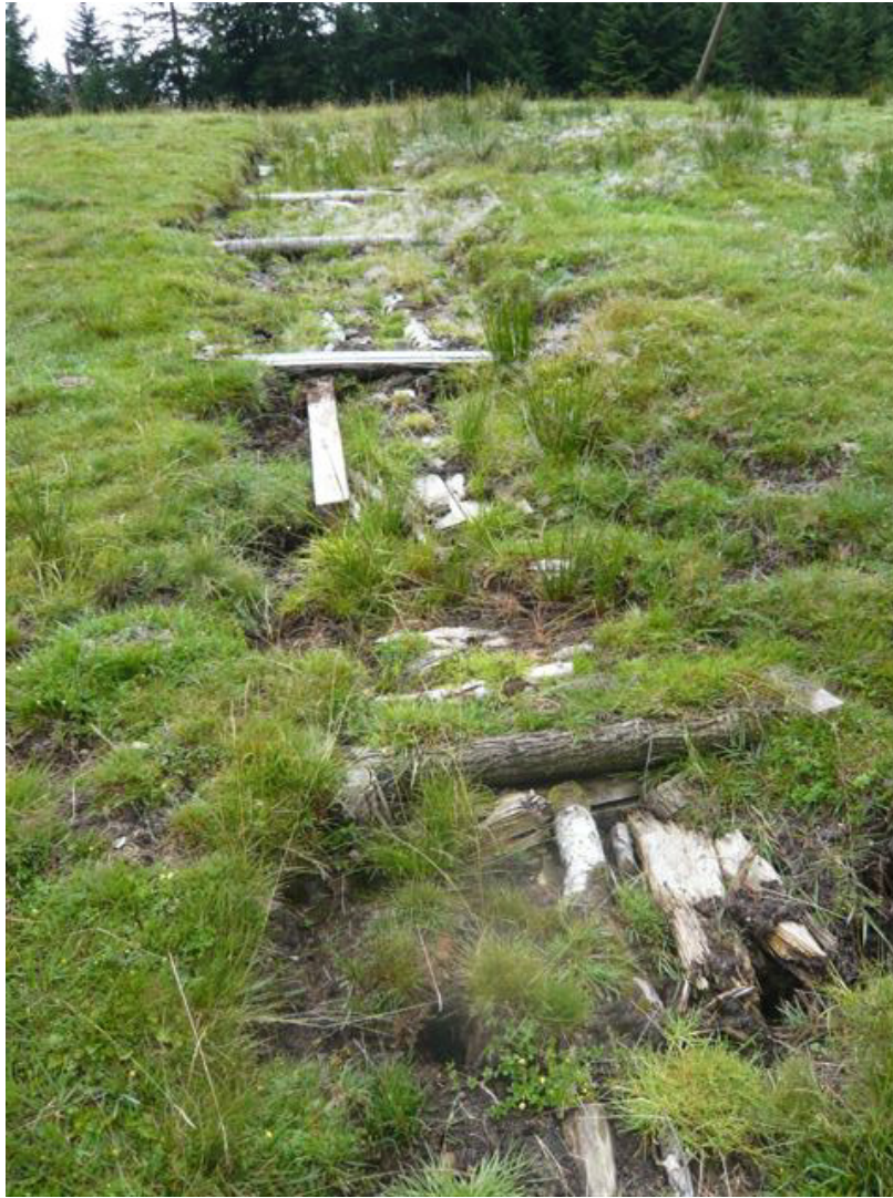
Photo 2. Échec partiel de la restauration d'une tourbière du fait de travaux de génie écologique inappropriés au regard de la pente, des ruissellements superficiels et de l'érosion des sols qui en résulte.

incertitudes réside dans la méconnaissance de la dynamique temporelle naturelle de ces milieux. Il est toutefois possible d'utiliser les travaux scientifiques existants, les retours d'expérience disponibles et les cycles biologiques des espèces présentes ou susceptibles de recoloniser les zones humides restaurées ; (iii) la complexité du paysage (ou approche systémique) et la valeur patrimoniale des zones humides.