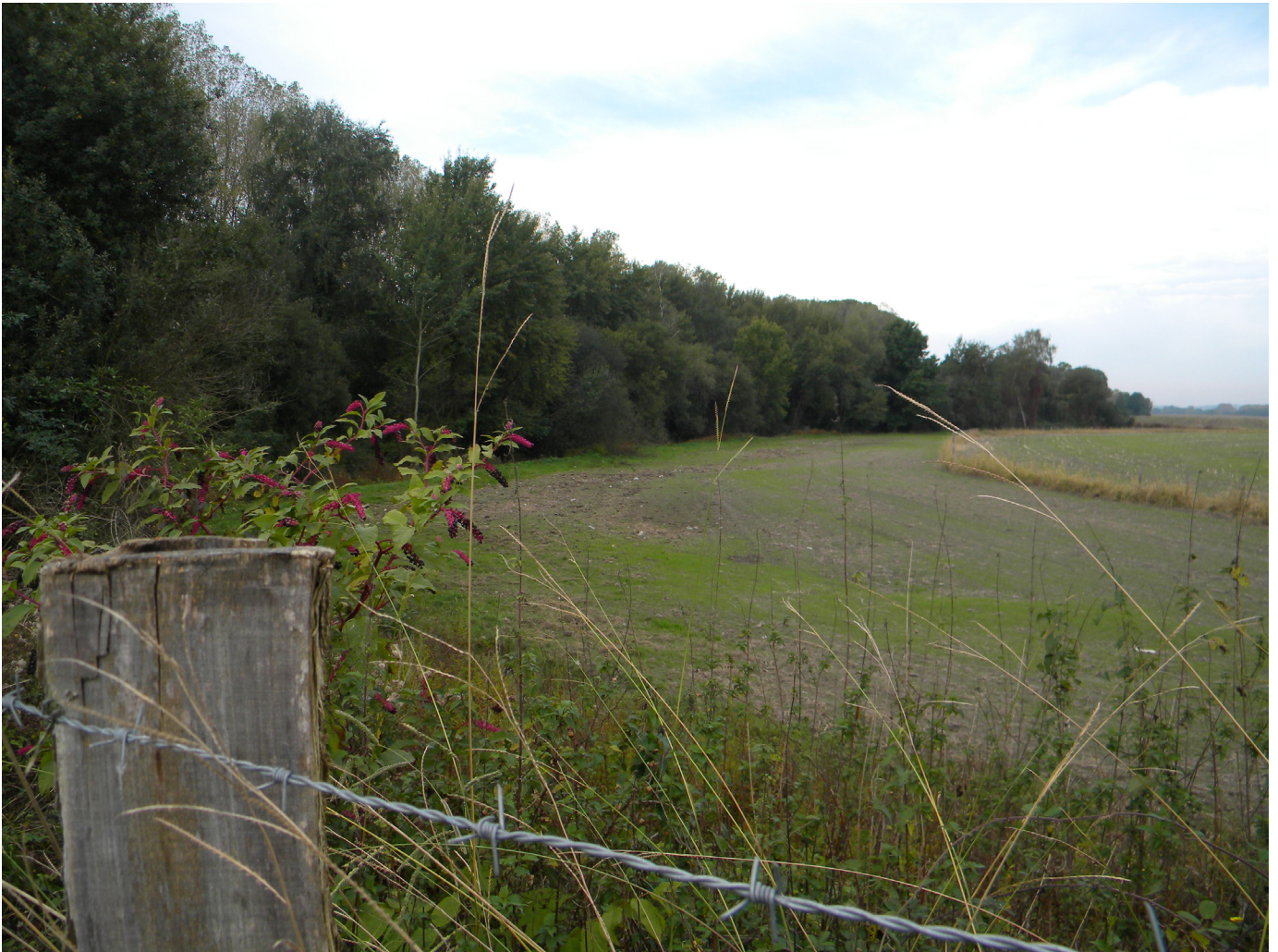
Photo 3. Site de compensation de l'autoroute A65 : conversion des cultures et restauration de prairies sur lesquelles un usage agricole est conservé (source : Nadia Moulin, Onema, 19 octobre 2012).

avec les propriétaires ? En l'occurrence, l'aéroport de Notre-Dame-des-Landes est implanté dans une zone agricole d'élevage de bovins pour la production de lait et de viande, avec de nombreuses formations bocagères. L'agriculture y est dynamique, fortement consommatrice d'espaces mais soumise à la contrainte d'une urbanisation rapide. Dans ce contexte, la profession agricole s'est opposée au projet (Pélessié et al. , 2013), en protestant notamment contre la « double peine » qui leur est imposée (perte de surfaces agricoles au profit de l'aéroport et de sa desserte routière, puis modification des pratiques culturales à cause des sites de compensation écologique). L'agriculture peut en effet apparaître comme une réserve foncière à mobiliser en cas de nécessité, avec les conséquences qui en découlent en termes de pertes d'emplois et de réduction du potentiel économique. Dans un tel contexte, passer des accords avec la profession agricole pour mener des actions à long terme