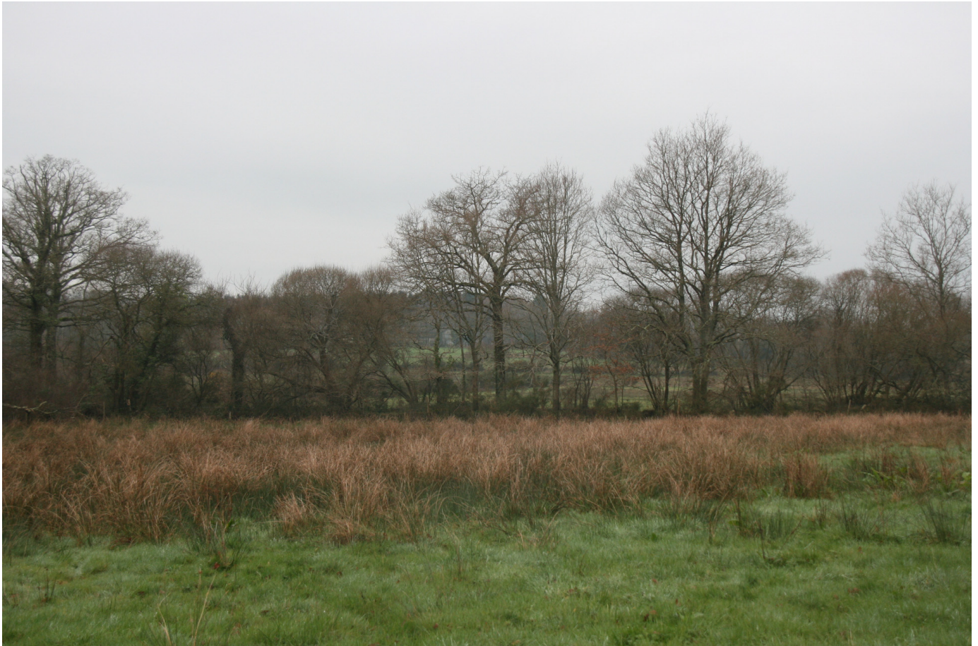
Photo 1. Bocage constitué de prairies humides mésohygrophiles et d'un réseau de haies situé sur le site du futur aéroport de Notre-Dame-des-Landes (source : Serge Muller, MNHN, 14 janvier 2013).

définition assez générale reconnue dans le monde entier, selon laquelle une zone humide est caractérisée par la présence d'eau stagnante ou courante, douce ou salée, que l'écosystème soit d'origine naturelle ou artificielle. Nous avons retenu ici la définition française qui est fondée sur la présence de sols hydromorphes et/ou de plantes hygrophiles et qui exclut les cours d'eau, les plans d'eau et les canaux. Le triptyque « présence d'eau variable dans le temps, de sols caractéristiques et d'espèces adaptées » structure les nombreuses définitions scientifiques existantes, l'accent étant mis sur un ou plusieurs de ces trois critères selon la discipline d'origine de l'auteur (hydrologie, pédologie, biologie). De nouveaux énoncés, issus d'un dialogue entre écologues, biologistes et économistes ont néanmoins émergé, intégrant notamment la problématique des « services écosystémiques » (Costanza et al. , 1997).