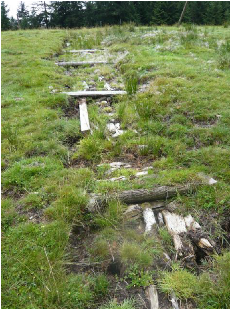
Photo 2. Échec partiel de la restauration d'une tourbière du fait de travaux de génie écologique inappropriés au regard de la pente, des ruissellements superficiels et de l'érosion des sols qui en résulte.

incertitudes réside dans la méconnaissance de la dynamique temporelle naturelle de ces milieux. Il est toutefois possible d'utiliser les travaux scientifiques existants, les retours d'expérience disponibles et les cycles biologiques des espèces présentes ou susceptibles de recoloniser les zones humides restaurées ; (iii) la complexité du paysage (ou approche systémique) et la valeur patrimoniale des zones humides.