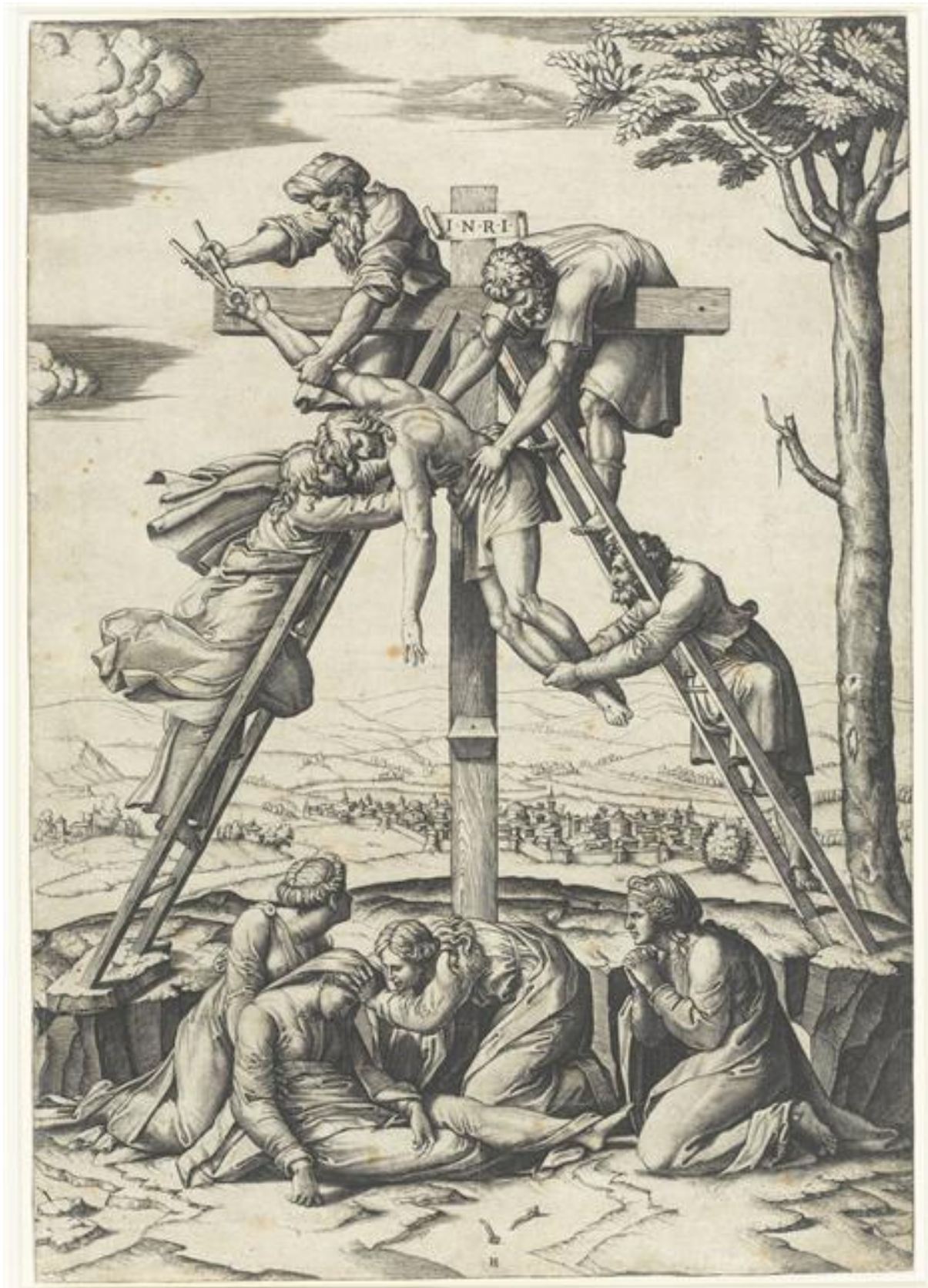
III. 4. . Marcantonio Raimondi, Descente de croix d'après Raphaël, v. 1520, gravure sur cuivre, 40,7 x 28,5 cm.