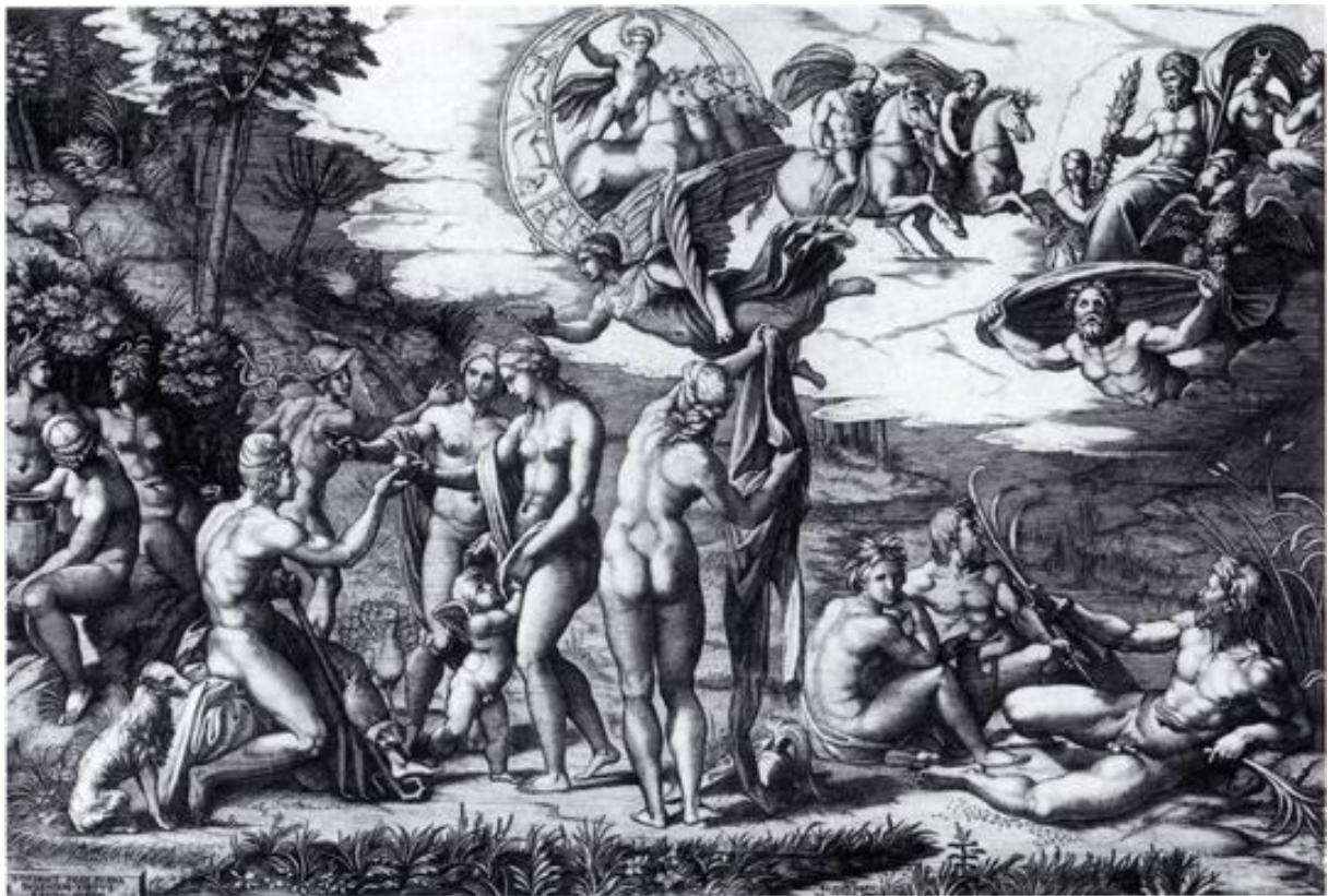
Ill. 2. Marcantonio Raimondi, Le Jugement de Paris d’après Raphaël, v. 1514-1518, gravure sur cuivre, 29,2 x 43,3 cm.

Les autres descriptions – et en particulier celle du Jugement de Paris d’après la gravure de Raimondi servent alors de contre-exemple tout à fait signifiant pour notre propos.