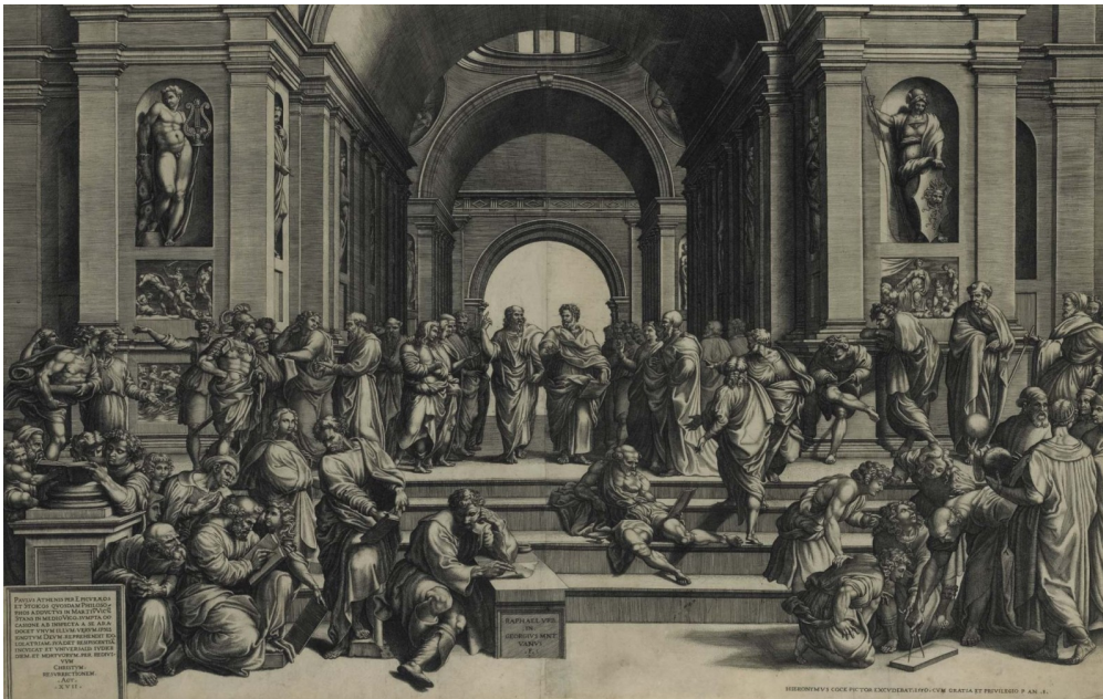
Ill. 1. Giorgio Ghisi, L'Ecole d'Athènes d'après Raphaël, 1550, gravure sur cuivre, 51 x 80,4 cm.

La description de cinq œuvres analysées d’après des gravures : le Jugement de Paris gravé par Marc-Antoine Raimondi d’après un dessin perdu de Raphaël, sur lequel nous reviendrons 11 , le Massacre des Innocents , gravé également par Marc-Antoine Raimondi 12 , la Descente de croix de Raphaël gravée également par Raimondi 13 , le Jugement Dernier de Michel-Ange 14 , et l’ Ecole d’Athènes contribuent à la démonstration et apparaissent ainsi comme des exercices pratiques d’une critique au cœur de laquelle se situe sa conception du costume. L’approfondissement de cette notion essentielle permet alors de mieux saisir à partir de la description d’une composition, le rapport ambigu entre fidélité à l’histoire et licence d’une part, et, même si Fréart ne fait pas grand cas de la différence entre l’œuvre originale et la gravure, la relation entre l’histoire et la manière ou entre le tableau et la pensée de l’artiste.