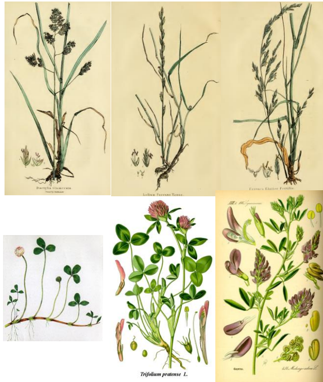
Figure 1 : dessins des espèces plus particulièrement étudiées dans le projet Climagie. Dactyle, ray-grass, fétuque, trèfles et luzerne.

question car les tests de sélection variétale sont des processus lourds. En revanche, nos capacités de prédiction des performances des mélanges pourraient grandement profiter de meilleures connaissances sur les réponses des différentes espèces fourragères composant les mélanges au milieu.