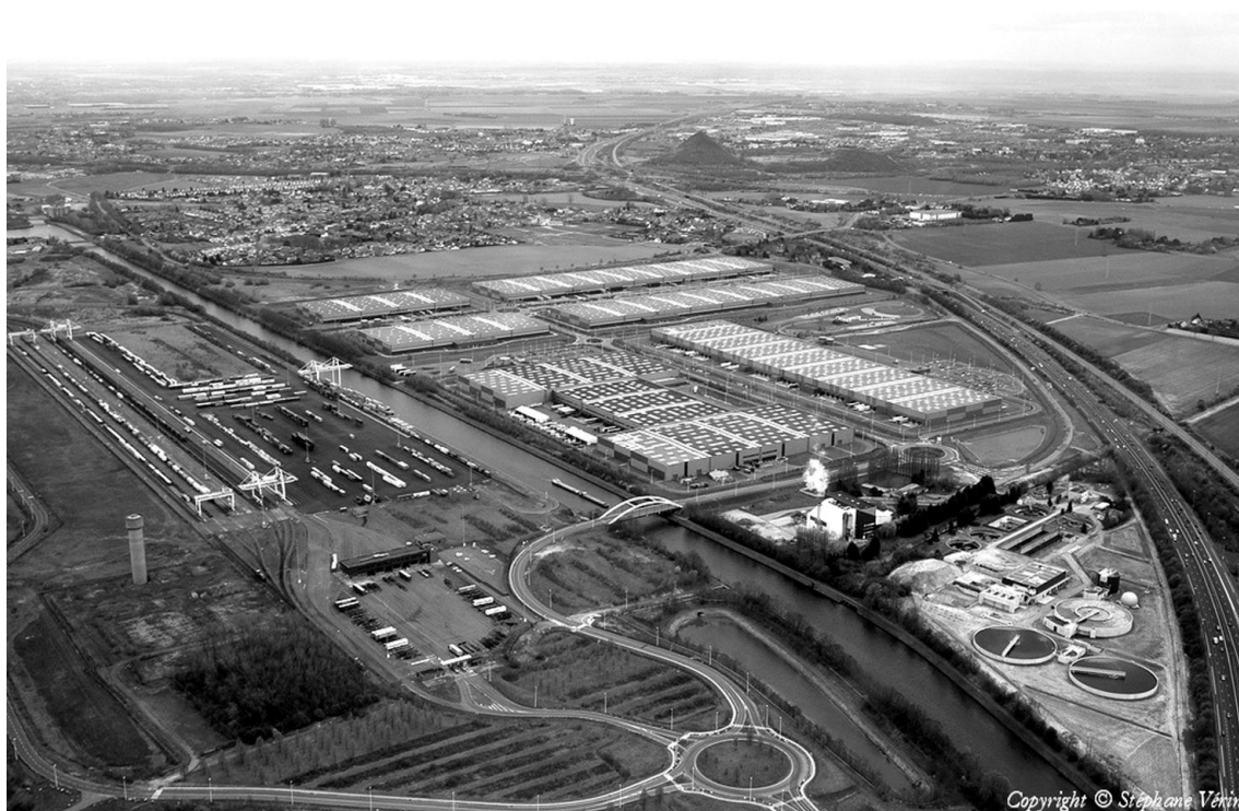
Figure 3 : Plate-forme multimodale Delta 3