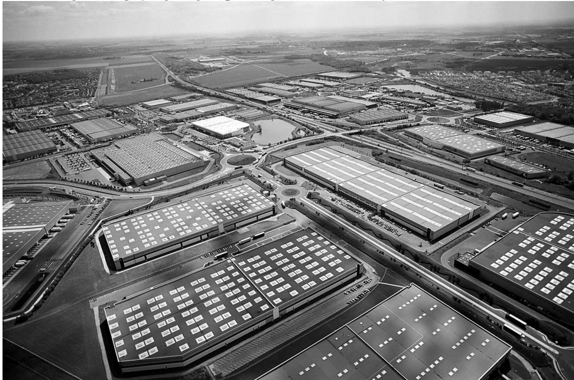
Figure 1 : paysage logistique de grande couronne francilienne (Sénart)