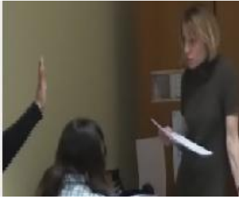
Figure 3: attribution de la parole à Habiba (ligne 5)