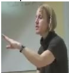
Figure 2: Geste interrompant la prise de parole non permise