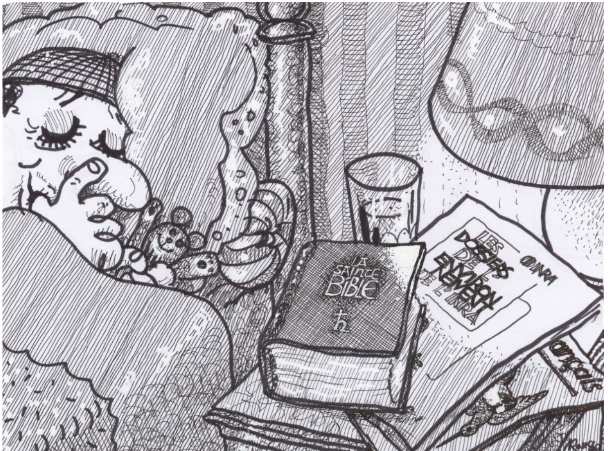
Dessin de Robert Rousso

...Voilà quelqu'un qui peut dormir tranquille!