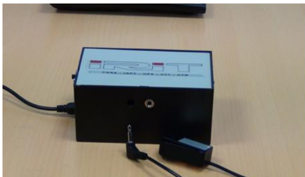
Figure 2. Boîtier physique.

Au préalable, le système MATT est configuré conjointement par la personne et son entourage médico-social ou familial. Ils définissent les modalités d'interaction du balayage (vitesse, stratégie de retour pour l'initialisation d'un nouveau balayage) et choisissent les représentations pictographiques des fonctionnalités les plus métaphoriques. La configuration d'interaction effectuée, la personne est installée devant son ordinateur sur lequel est connecté le boîtier MATT. Le contacteur le plus adapté aux capacités résiduelles motrices de la personne est branché au boîtier. C'est par celui-ci que la personne pilote le mode balayage de l'interface. Dans un premier temps l'utilisateur va sélectionner son activité (télévision, internet, communication, téléphone, musique, jeux), puis