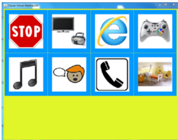
Figure 3. Exemple d'une interface virtuelle

l'interface proposera les différentes actions possibles pour celle-ci.