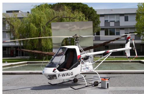
Figure 1. L'hélicoptère électrique Volta de la société Aquinea

Volta est un hélicoptère électrique conventionnel avec une motorisation 100% électrique (voir Figure 1). L'ENAC a collaboré à la mise en oeuvre du tableau de bord de l'appareil. Pour ce projet, la contrainte temporelle était un facteur important, car les essais devaient être réalisés au plus tôt, dans un cadre de concurrence internationale.