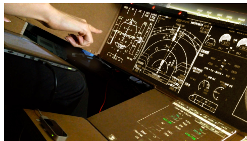
Figure 4. Le cockpit en carton

une maquette de cockpit en carton développée par Intac-tile Design, permet de tester très rapidement de nouvelles combinaisons de modalités.