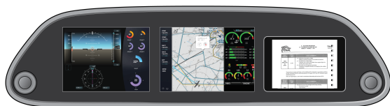
Figure 3. Une vue d'ensemble du tableau de bord de l'avion école

L'ENAC mène une réflexion sur le cockpit des futurs avions école, destiné aux premières heures d'instruction des pilotes. En raison de la nature très particulière des vols effectués lors de ces premières heures, ces avions peuvent faire appel à des modes de propulsion moins bruyants mais à autonomie limitée. D'autre part leur planche de bord peut être conçue en fonction des besoins spécifiques de l'instruction.