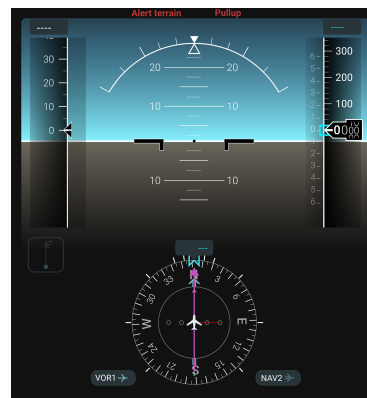
Figure 5. Le Primary Flight Display (PFD) développé

Dans ce dernier exemple, nous nous appuyons sur un scénario concret de conception d'un PFD (Primary Flight Display), issu d'observations en milieu industriel, pour illustrer comment djnn permet de mettre en oeuvre les diverses phases des processus de développement.