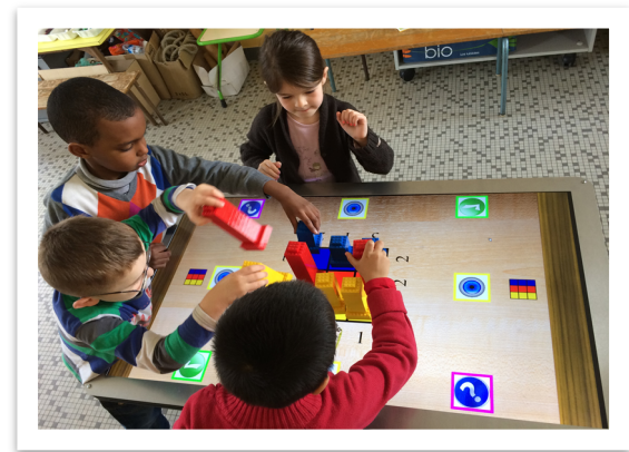
Figure 1. La table TangiSense et le "Jeu des Tours" lors d'une expérimentation en classe primaire

Permission to make digital or hard copies of part or all of this work for personal or classroom use is granted without fee provided that copies are not made or distributed for profit or commercial advantage and that copies bear this notice and the full citation on the first page. Copyrights for third-party components of this work must be honored. For all other uses, contact the Owner/Author. Copyright is held by the owner/author(s). IHM '15, Oct 27-30 2015, Toulouse, France