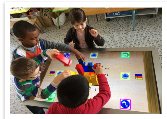
Figure 1. La table TangiSense et le "Jeu des Tours" lors d'une expérimentation en classe primaire

Permission to make digital or hard copies of part or all of this work for personal or classroom use is granted without fee provided that copies are not made or distributed for profit or commercial advantage and that copies bear this notice and the full citation on the first page. Copyrights for third-party components of this work must be honored. For all other uses, contact the Owner/Author. Copyright is held by the owner/author(s). IHM '15, Oct 27-30 2015, Toulouse, France