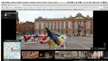
Figure 3. Une vue détaillée d'une photo avec la référence à l'endroit exact où elle a été prise