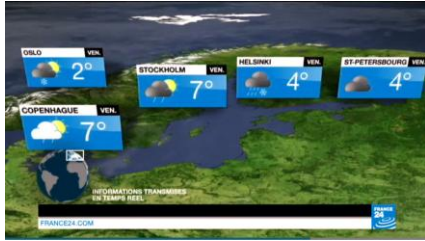
Figure 4. Un écran d'un programme de météo illustrant différents niveaux d'information sur un seul dispositif (issue du bulletin météo de France 24)

tion; comme dans une interface FC, des vues agissent comme un contexte continu d'autres, plus détaillées, améliorent la capacité de comprendre et d'interpréter la signification des données à chaque niveau.