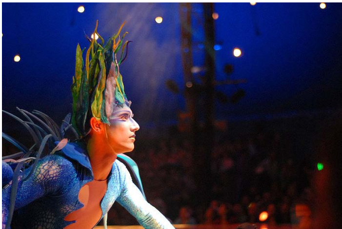
Cirque du Soleil's Varekai in Melbourne

Trabajando con las artes hemos de tener en cuenta, y de manera fundamental,