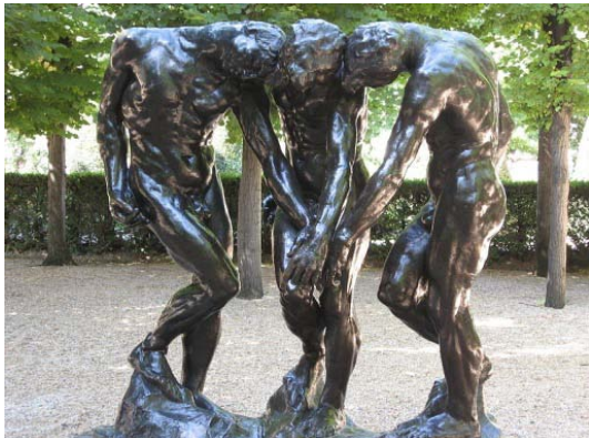
Las tres sombras (Museo Rodin, París)

Siguiendo esta misma idea, las mismas autoras, plantean el proyecto “El espacio y las formas a partir de las obras de Augusto Rodin” (Pérez-Roux y Thomas, 2000), propuesto más