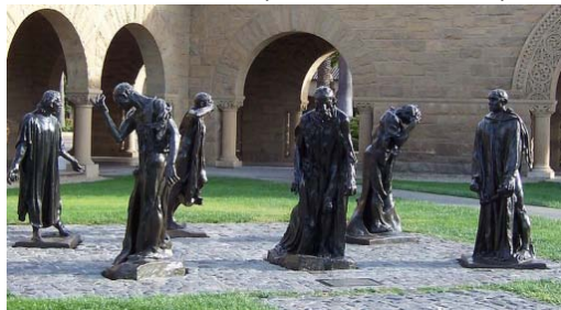
Los burgueses de Calais (Universidad de Stanford)

tarde por la Inspección educativa de Fréjus /Saint Raphaël 5 y llevado a cabo con escolares de primaria durante el curso 2003/2004.