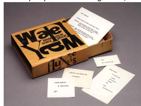
Water Yam, by George Brecht, 1963