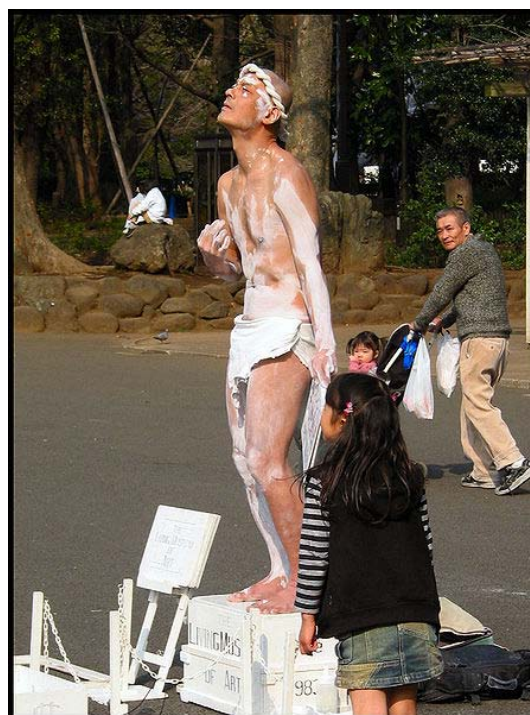
Performance of an artist in Tokyo Ningyou