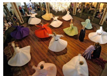
Derviches giradores en Turquía.

interculturalidad”, disponible en: http://www.redeaipe.ru.org/textos/Art%3%adculo%20Roc%3%ado.doc podemos encontrar una reflexión sobre este tema.