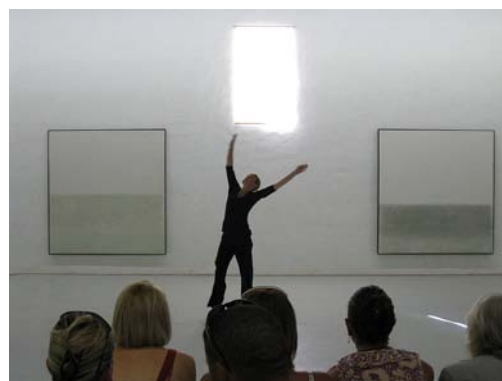
Performance danse musée – Sigean(Aude) Francia