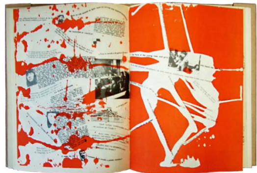
Mémoires by Guy Debord and Asger Jorn, 1959