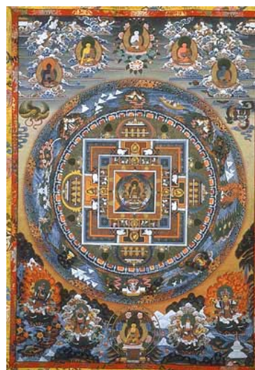
Mándala del Buda Sakyamuni, pintura tibetana.