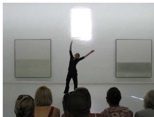
Performance danse musée – Sigean(Aude) Francia