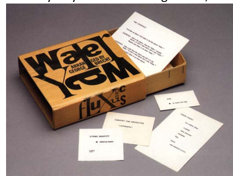
Water Yam, by George Brecht, 1963