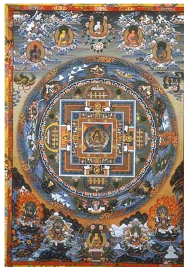
Mándala del Buda Sakyamuni, pintura tibetana.