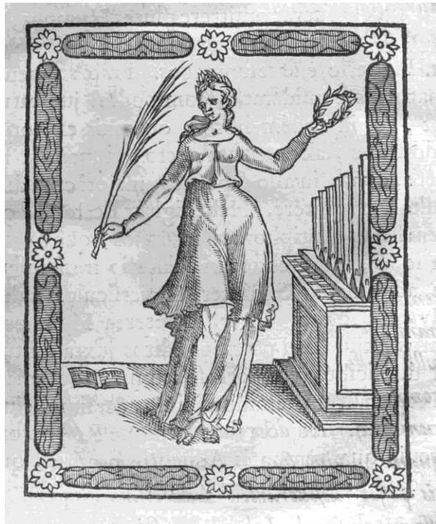
1. Sainte-Cécile . Gravure sur bois provenant de l’atelier Le Roy et Ballard, troisième tiers du XVI e siècle.

Hélas, aucune affiche du Puy d’Évreux imprimée au XVI e siècle ne nous est parvenue. Le seul indice qu’on connaisse, c’est un bois gravé (90 x 111 mm) représentant sainte Cécile provenant du fonds des imprimeurs Ballard ( fig. 1 ). Ce bois n’est repéré que dans un graduel de 1655 et dans un antiphonaire de 1660 3 , mais comme il ressort clairement au style du XVI e siècle 4 il a probablement été utilisé à cette époque. Il pourrait s’agir du bois gravé auquel il est fait allusion en 1575, puisque dans l’atelier des Ballard les ornements, les bois gravés et les polices datant du XVI e siècle étaient largement utilisés plus d’un siècle plus tard.