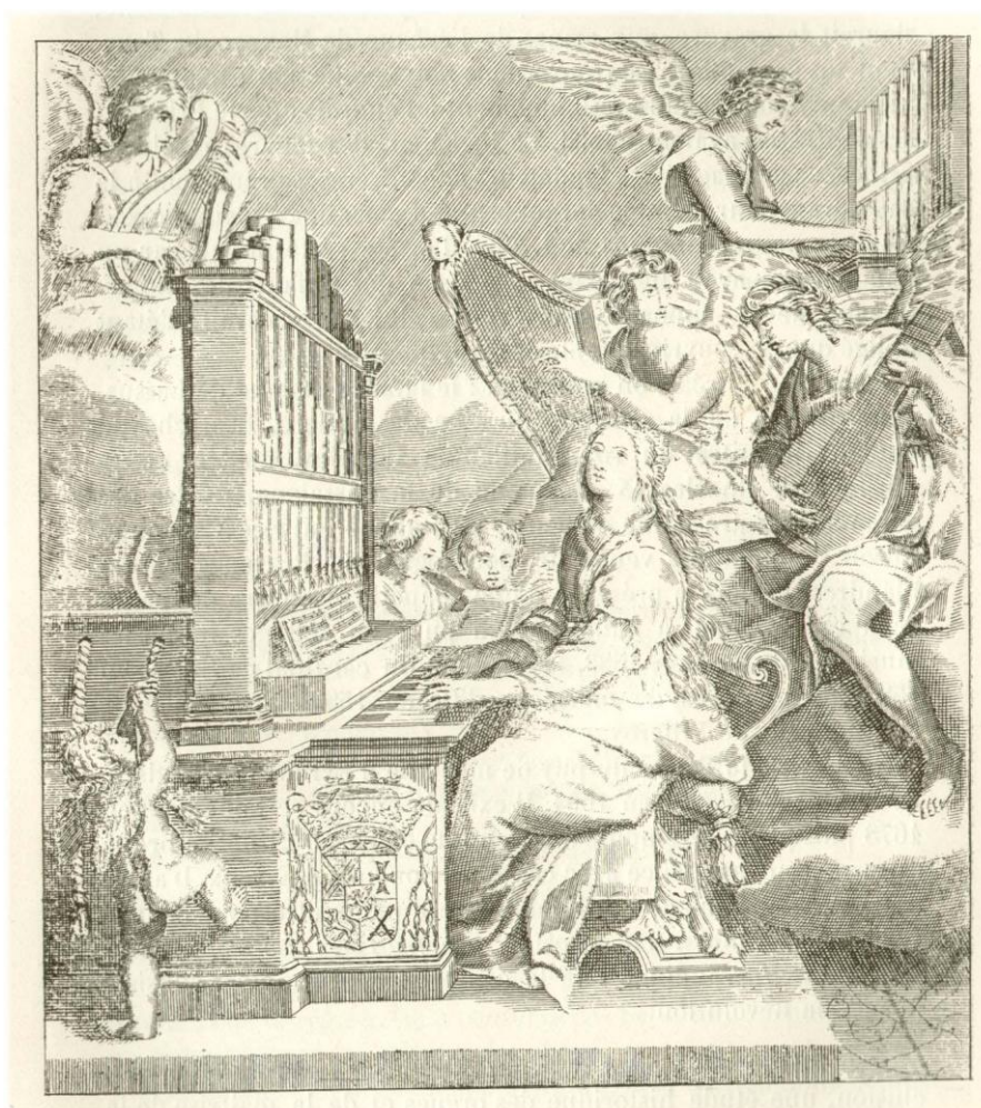
3. Sainte-Cécile à l'orgue . Gravure de Pierre Firens, c. 1664-66.

Sous la cote D 5, les Archives Départementales de l'Eure conservent un fragment d'affiche (fig. 2, reproduit aussi par Teviotdale 1993 p. 18) qui présente les éléments suivants : un sonnet en l'honneur de Henry Cauchon de Maupas du Tour, évêque d'Évreux et prince du Puy cette année-là; une ode latine pour le même; une ode française pour le même; les noms des gagnants du Puy de 1666, ce qui permet de dater l'affiche de 1667; des consignes aux compositeurs sur la manière de mettre les paroles en musique, d'autres sur la manière d'envoyer leurs œuvres en respectant l'anonymat; et le bas d'une gravure centrale, malheureusement découpée, mais qui laisse apparaître la signature Firens fe.