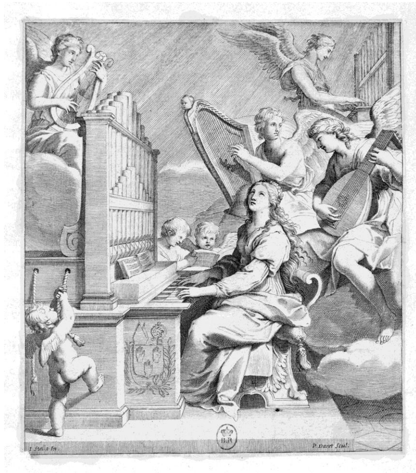
5. Sainte-Cécile à l'orgue . Gravure de Pierre Daret d'après Jacques Stella. Paris, Bibliothèque nationale de France, Cabinet des estampes, Da 20 fol. (p. 83).

En fait, il apparaît que la gravure de Firens n'est qu'une copie un peu affadie d'une autre gravure, déjà connue, gravée par Pierre Daret sur un dessin de Jacques Stella (fig. 5) 10 .