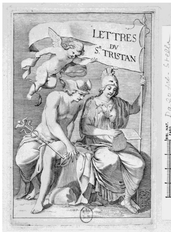
7. Frontispice pour Tristan L'Hermite, La Lyre du sieur Tristan , 1641. Gravure de Pierre Daret sur un dessin de Jacques Stella.