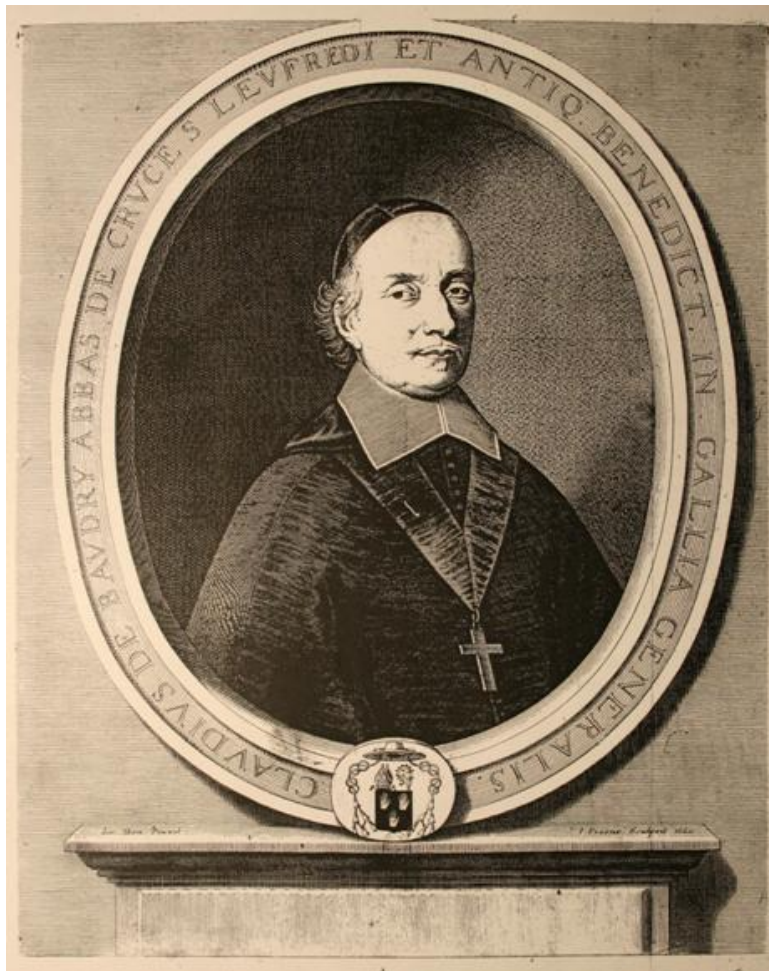
6. Claude Baudry de Piencourt . Gravure de Jean Frosne d'après un portrait de Le Bon, 1657. Paris, Bibliothèque nationale de France, Cabinet des estampes, N 2 fol.

dry de Piencourt († 1669). En 1618, il avait reçu l'abbaye de La Croix Saint-Leufroy 11 , au nord d'Évreux sur la rive de l'Eure, qu'il dirigea jusqu'à sa mort le 17 janvier 1669. On possède un portrait de lui gravé en 1657 par Jean Frosne d'après une peinture de Le Bon, qui présente les mêmes armes que sur la gravure de Daret ( fig. 6 ) 12 .