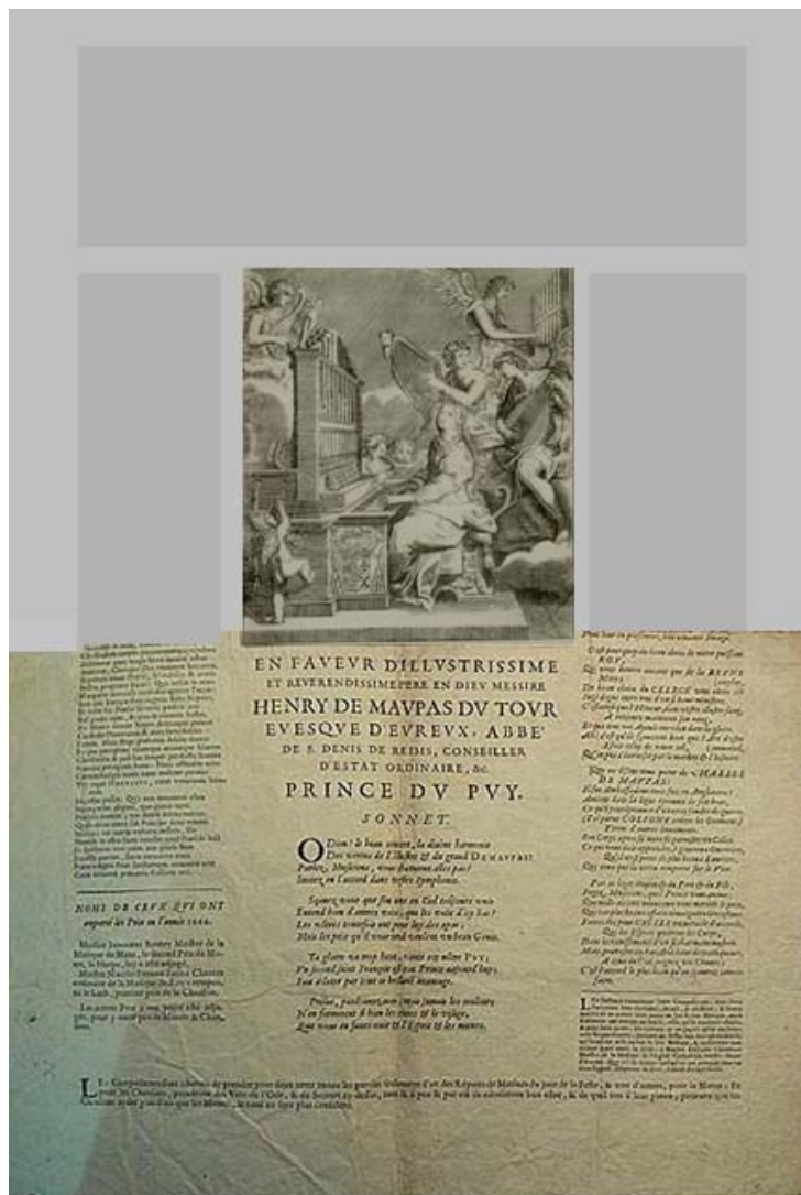
4. Une reconstitution possible de l'affiche du Puy d'Évreux de 1667.

rait la gravure, aux armes de l'évêque de Maupas du Tour, dont un exemplaire se trouve dans notre collection personnelle 6 . » À observer les parties inférieures de la gravure de Delamare et de celle de l'affiche, il est clair qu'elles concordent : on distingue bien l'estrade striée en traits verticaux sur presque toute la largeur, et un fragment du carrelage à droite 7 . La dédicace de l'affiche à Henri Cauchon de Maupas du Tour et la présence de ses armes épiscopales sur la gravure de Delamare prouvent que cette gravure provient de l'affiche. Nous pouvons donc tenter une reconstitution approximative de l'affiche de 1667, avec une gravure centrale, deux colonnes de texte de chaque côté, et probablement un bandeau plus ou moins ornementé par-dessus (fig. 4).