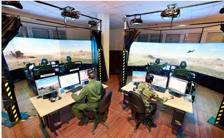
Figure 2. Vue de deux cabines EDITH V3 avec deux animateurs et quatre stagiaires.