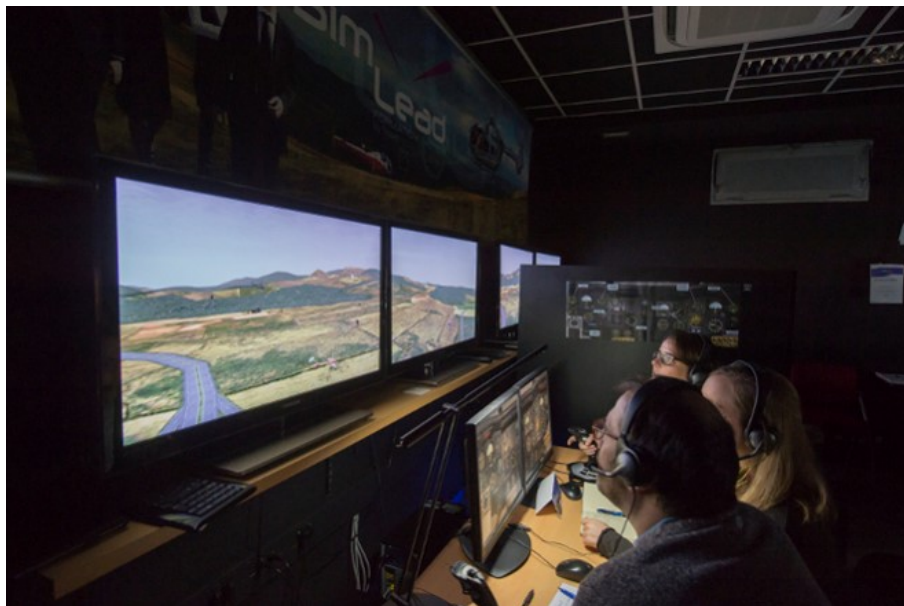
Figure 3. Vue d'une cabine SimLead.

Le simulateur SimLead est généralement considéré comme l'équivalent du dispositif EDITH à juste titre puisqu'il s'agit d'une « filiation » technologique directe au sein de la même entreprise. On constate toutefois des différences notables qui peuvent impacter les méthodes d'apprentissage. SimLead dispose en effet de beaucoup moins de fonctionnalités que son homologue militaire. Si la disparition des systèmes d'armes est clairement justifiée, certaines absences de capacités semblent moins compréhensibles comme par exemple l'impossibilité d'enregistrer les exercices afin d'étudier en débriefing les trajectoires des aéronefs et les communications.