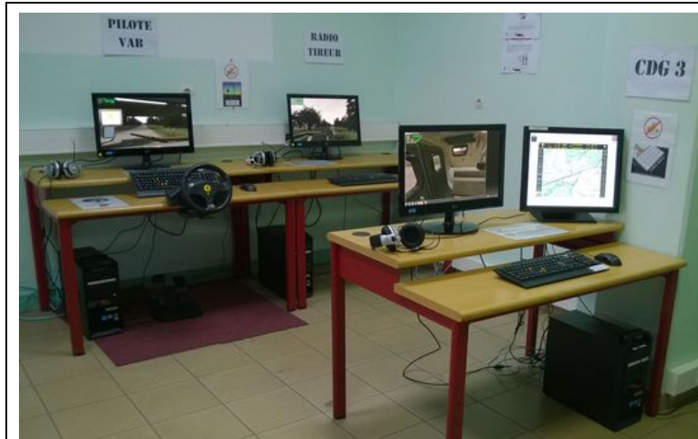
Figure 2. Représentation d'un équipage sous Spartacus. Le SIOC se situe sur l'écran de droite de l'ordinateur au premier plan (place du chef).

et du comportement des apprenants dans la simulation. Une intervention technique de l'équipe d'exploitation est en permanence possible pour éviter de stopper la séance et ainsi couper le fil de l'exercice et les démarches cognitives des apprenants. Une phase de debriefing est menée à l'issue de chaque mission. Elle permet aux stagiaires placés en situation de commandement de rendre compte du déroulement de la mission. Le formateur revient, éventuellement, en illustrant son propos par les enregistrements sur les situations d'apprentissage. Les séances ne sont pas encore notées puisque Spartacus n'a pas été approuvé pour le service.