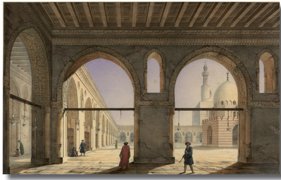
Vue de la cour de la mosquée Teyloun