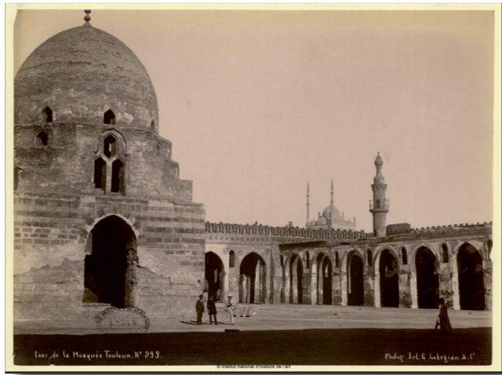
Cour de la mosquée Touloun