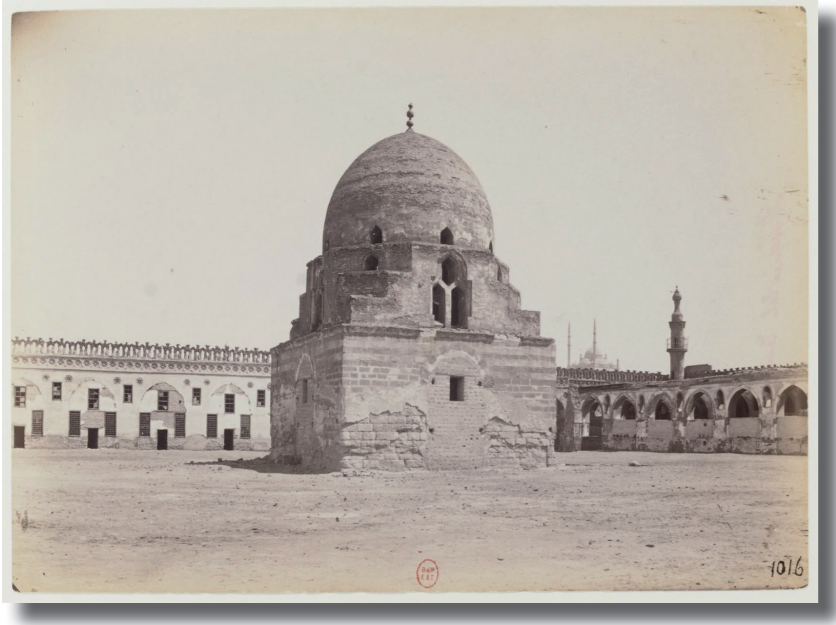
Mosquée El Tulun