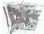
Plan global du projet urbain (1:3 Km x 2,5 Km)

La méthodologie : entretiens avec les différents acteurs de l'urbanisme commercial ; observations effectuées in situ sur des dispositifs spatiaux ; analyse de plans et de coupes ; typologie de construction comme les entrées, les vitrines ou les toitures.