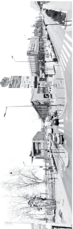
Vue depuis l'avenue (sens fil des vélos) qui passe au centre du complexe de commerces et de loisirs.