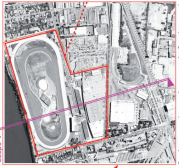
Emploie du carré de soie au carré de soie et le pôle multimodal au sud (100 Murs x 100 Murs)