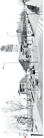
Vue depuis l'avenue (sens fils deux voies) qui passe au centre du complexe des commerces et de loisirs.