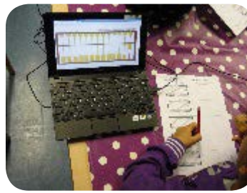
Fiches papier/crayon et boulier virtuel (en GS)