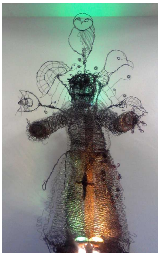
Figura 5: Imagem da Escultura de São Francisco

Em um encontro de formação destinado a todos os acadêmicos e professores do curso de Pedagogia, foram apresentadas a sequência de atividades desenvolvidas relatando todas as etapas até chegar a concretização da escultura.