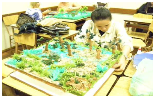
Figura 2: Maquete Mata Atlântica

Com as atividades acima descritas, houve a aproximação qualificação dos saberes de senso comum por meio dos conhecimentos científicos.