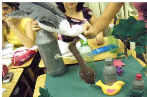
Figura 3: Maquete Cadeia Alimentar