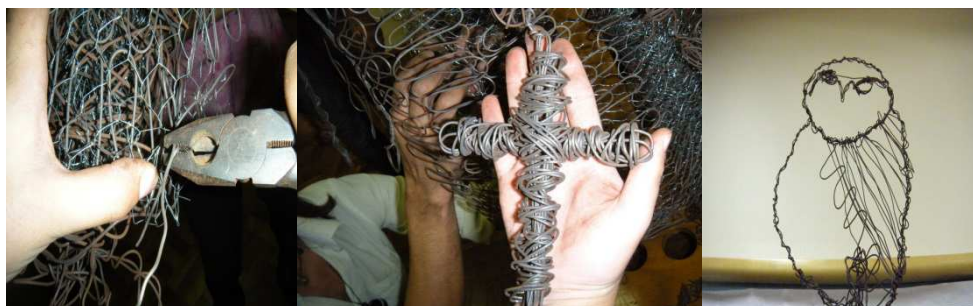
Figura 4: Sequência de Atividades na Execução da Escultura

construir a escultura de São Francisco acompanhado de animais silvestres do RS. Como material utilizou-se arames e telas, dentre outros recursos, visualizados na figura 4. Teve-se como obra sistematizadora dos diferentes saberes envolvidos a escultura representada na figura 5.