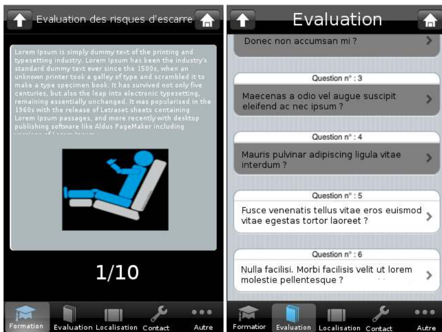
Figure 2. Exemple générique de fiche pédagogique et d'évaluation proposées par "Escarre"

thème. L'auto-évaluation [Figure 2] s'appuie sur un panel de questions couvrant l'ensemble des informations expliquées dans les différents thèmes. L'utilisateur peut ensuite choisir de voir les réponses afin de mieux comprendre ses erreurs. L'objectif est de lui permettre d'établir son bilan de ses acquis.