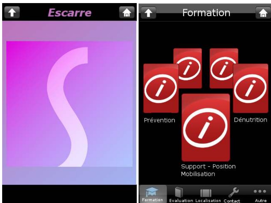
Figure 1. Démarrage de l'application et son carrousel

une masse d'informations à l'utilisateur. La navigation lui permet en effet de sélectionner rapidement l'information recherchée et elle seule. Cet ensemble de fonctionnalités et d'onglets de base n'est pas figé dans le code de l'application. Il est ainsi aisé de rajouter des onglets ou cartes dans le carrousel par configuration de l'application.