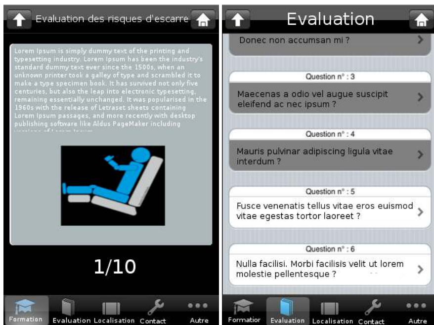
Figure 2. Exemple générique de fiche pédagogique et d'évaluation proposées par "Escarre"

thème. L'auto-évaluation [Figure 2] s'appuie sur un panel de questions couvrant l'ensemble des informations expliquées dans les différents thèmes. L'utilisateur peut ensuite choisir de voir les réponses afin de mieux comprendre ses erreurs. L'objectif est de lui permettre d'établir son bilan de ses acquis.