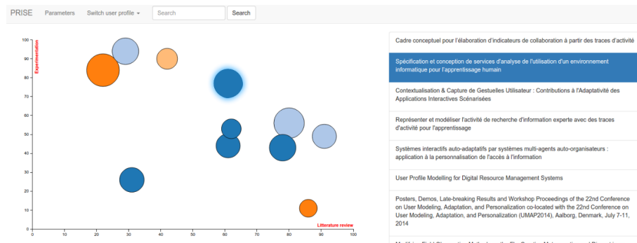
Fig. 2. : Exemple de représentation visuelle

Dans le cadre de notre étude, nous avons mis en place un environnement appelé PRISE (PeRsonal Interactive research Smart Environment). PRISE [5] est un environnement dédié à la recherche permettant une gestion consolidée de ressources numériques. Il contient : un espace de gestion de ressources numériques, un réseau social, un système de gestion de tâches, d'événements et de collaborateurs. Chaque profil est par ailleurs modélisé par une extension du IMS-LIP [15]. PRISE fournit donc l'ensemble des données nécessaires à l'expérimentation de notre approche. Pour les besoins de l'expérimentation, nous avons identifié trois profils d'usage : état de l'art , expérimentation , approche ou méthodologie . Ces profils sont automatiquement déterminés en fonction de l'historique d'usage ( nombre d'utilisateur ayant utilisé la ressource avec ce besoin ), contexte d'usage ( objectif du concepteur et de l'utilisateur ), satisfaction ( niveau de satisfaction de l'utilisateur ), accessibilité ( public ou privé ). La Fig. 2 est un exemple d'une représentation adaptée de résultats de recherche. Ces résultats sont affichés sous forme de liste et représentés dans un espace à deux dimensions en fonction des profils d'usage. Les caractéristiques de chaque résultat (ici les points) indiquent la pertinence de la ressource sur le critère associé (position : historique d'utilisation dans le contexte déterminé par les axes, couleur : type de ressource, ...).