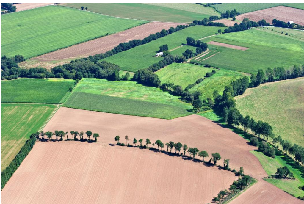
Figure 1 - La géométrie du parcellaire, la gestion des parcelles cultivées et les structures paysagères déterminent une configuration du paysage qui permet de moduler l'impact du changement climatique sur les sols

Les sols sont une ressource peu renouvelable qui assure des fonctions et des services essentiels pour l'homme et les écosystèmes. La pression anthropique sur les sols et les effets supposés du changement climatique conduisent à envisager des modifications significatives de leurs propriétés à l'échelle de décennies. Le projet Landsoil a abordé les relations entre l'évolution des sols agricoles et celle du contexte climatique et de l'organisation des paysages, à des échelles de temps allant de la décennie au siècle (Figure 1). Il avait pour objectif de quantifier et modéliser les effets de la structure du paysage sur la redistribution des sols et sur la dynamique du stockage de carbone dans les sols. Il a comparé trois agrosystèmes très différents (bocage en Bretagne, openfield en région Centre, viticulture en Languedoc-Roussillon) et intégré les évolutions prévisibles de climat et de changement d'usage des sols.