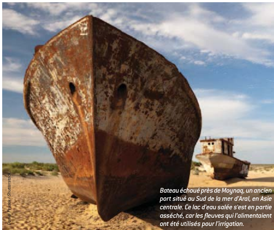
Bateau échoué près de Moynaq, un ancien port situé au Sud de la mer d'Aral, en Asie centrale. Ce lac d'eau salée s'est en partie asséché, car les fleuves qui l'alimentaient ont été utilisés pour l'irrigation.

Quant aux stratégies d'acceptation, elles visent à adapter le milieu urbain aux inondations de certains quartiers, ce qui se traduirait par des constructions sur pilotis (par exemple au Bangladesh) ou des habitations « flottantes » (comme aux Pays-Bas),