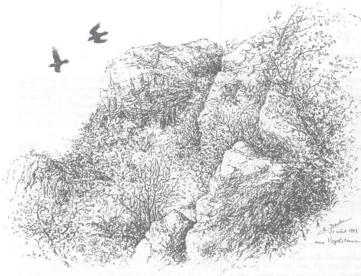
Grands corbeaux aux Vogelsteine

de reconstituer sur tout son territoire des forêts primaires pour « nos enfants et les enfants de nos enfants »