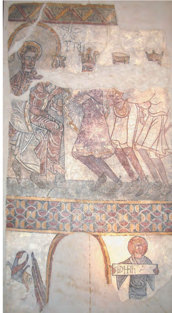
Fig. 5 : Adoration des Mages, Hospice d'Ille-sur-Têt.

Dans le panneau inférieur, de part et d'autre de la fenêtre, on apercevait un griffon et un personnage déployant un phylactère avec une épigraphe qui a perdu la partie droite. L'inscription en lettres capitales, très difficile à déchiffrer, est tracée en noir dans un rectangle blanc, avec quelques lettres à l'envers : GNLBR-CHRTIH. Selon nous, ce texte doit être lu de la manière suivante : G(e)N(erationis) L(i)B(e)R CHRI(s)T(i) IH(esu), car il s'agit du début de l'Évangile de Matthieu : « Liber generationis Iesu Christi filii David, filii Abraham » (Mt. 1, 1). Il faut rappeler que les textes avec les débuts des quatre Évangiles étaient utilisés en Catalogne romane lors du rituel de la bénédiction de l'autel, d'après les indications de l'ordo catalano-narbonnais , comme l'attestent