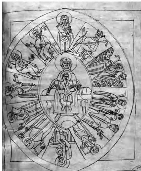
Fig. 12 : Évangélaire de Saint-Michel-de-Cuxa, ms. 1, f. 21.

semble être un vecteur de transport simple pour la diffusion des modèles, s'enrichissant, productions après productions des cultures qu'il traverse. L'origine locale d'un peintre formé dans un scriptorium , centre de production artistique, rayonnant sur ses possessions, est aussi tout à fait envisageable. En effet, un détail comme le dessin d'une croix sur le maphorion de la Vierge sur la scène de l'Épiphanie a été sans doute emprunté à des représentations de Marie de l'Évangélaire de Cuxa (f. 107r). De la même manière, le sacramentaire Moussoulens (vers 1100-1125), conservé au Trésor Notre-Dame de l'Abbaye à Carcassonne, dont les enlumineurs peuvent aussi être associés à la peinture catalane de la première moitié du XII e siècle, fait également partie des sources à considérer. Dans ce manuscrit, probablement réalisé dans un centre du Roussillon, Conflent ou Vallespir entre 1100 et 1125, se trouve une représentation de la Crucifixion (f. 10r), avec des personnifications du soleil