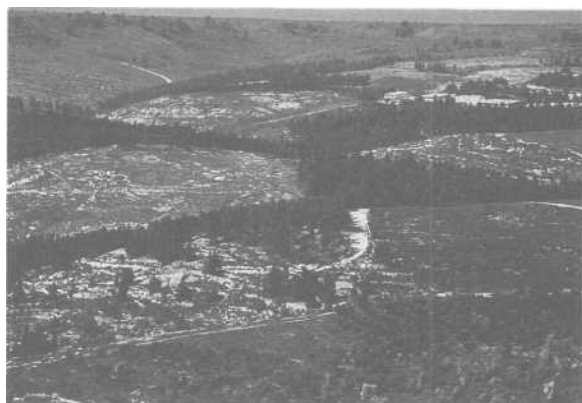
Reboisement en Galilée

L'imbrication de ces lieux-sanctuaires à l'authenticité souvent controversée - il y a deux sites pour le Golgotha - fait de la vieille ville derrière ses remparts un espace de tension sociale et politique permanente. La présence obsédante des patrouilles militaires le rappelle à chaque instant aux hiérosolymitains comme aux étrangers à la ville. A l'est de la ville, des lotissements modernes sur le sommet des collines indiquent ostensiblement que l'Etat d'Israël ne saurait admettre à nouveau une coupure de Jérusalem en deux.