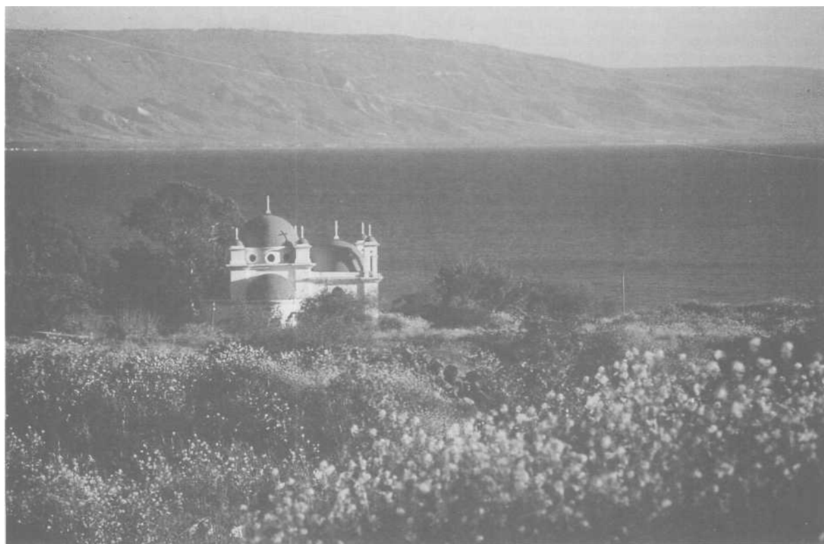
Monastère au bord du lac de Tibériade

Comme dans la vision romantique, l'histoire fonde le texte