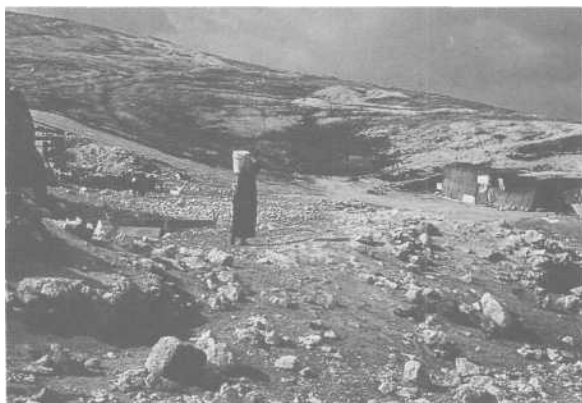
Territoire arabe occupé (Samarie)

Le circuit, qui est ouvert aux visiteurs dans les collines semi-arides de Samarie plantées d'oliviers, est jalonné par des étapes où sont reconstituées des scènes décrites dans l'Ancien Testament : une aire de battage du blé et de l'orge, un pressoir à huile d'olive, un pressoir à vin, le vignoble du Carmel ou une petite mare ( pond of sheperdness ) où le visiteur attend d'improbables troupeaux. A la station 12 (ombragée), dans la vallée du « Songe des songes », le texte