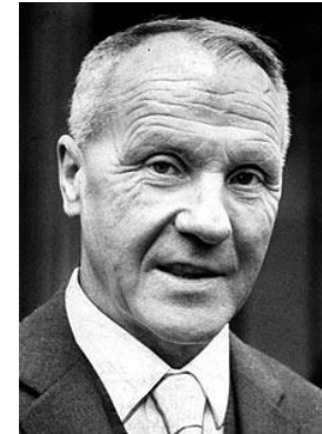
Bill Shankly 1913-1981

“Aim for the sky and you'll reach the ceiling. Aim for the ceiling and you'll stay on the floor.”