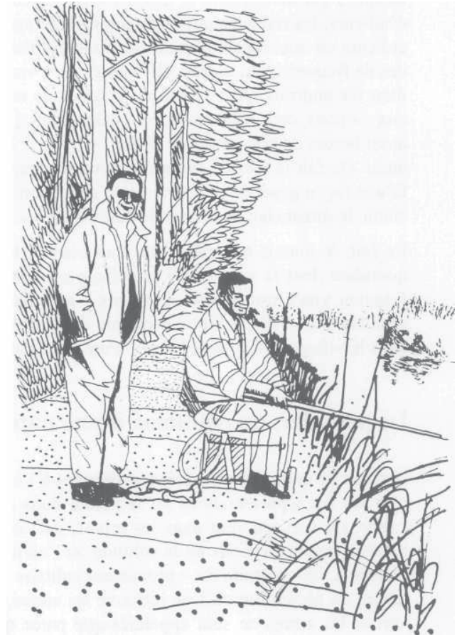
Dessins de Claire Brenot, d'après des photographies de Sophie Le Floch