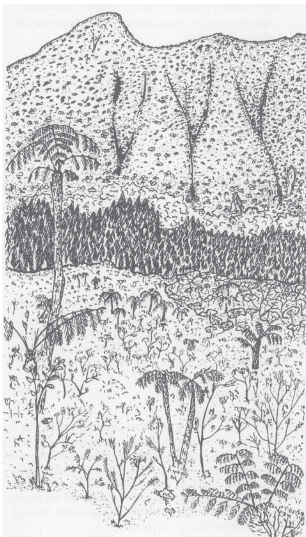
Paysage du piton de Bébour (M. Attié de/.)

THÉBAUDC, 1989. Contribution à l'étude des plantes étrangères envahissantes à l'île de La Réunion . Rapport ONF-Conseil régional de La Réunion.