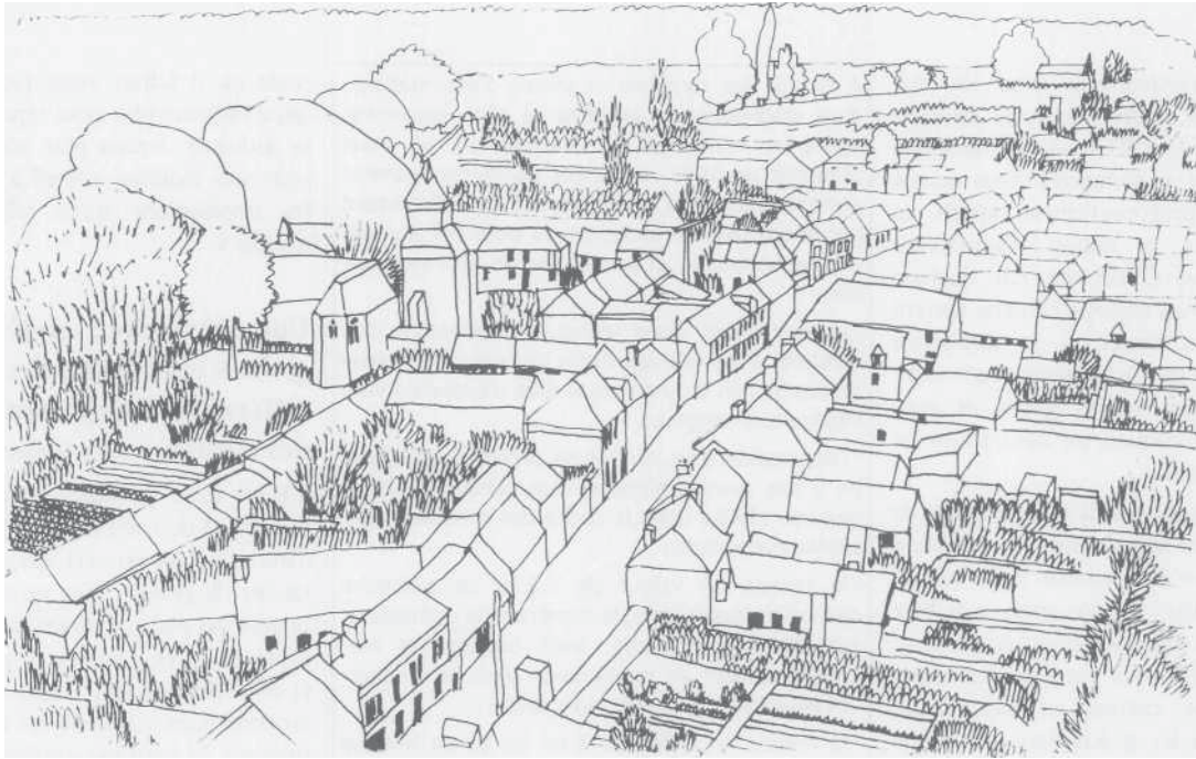
La Croix Saint-Leuffroy dessin CES d'après photo

d'azote qui limite d'autant mes apports », commente-t-il, tout en soulignant que « cela me permet aussi d'étaler mes pointes de travail. J'ai moins l'impression de courir après le temps au moment des blés ».