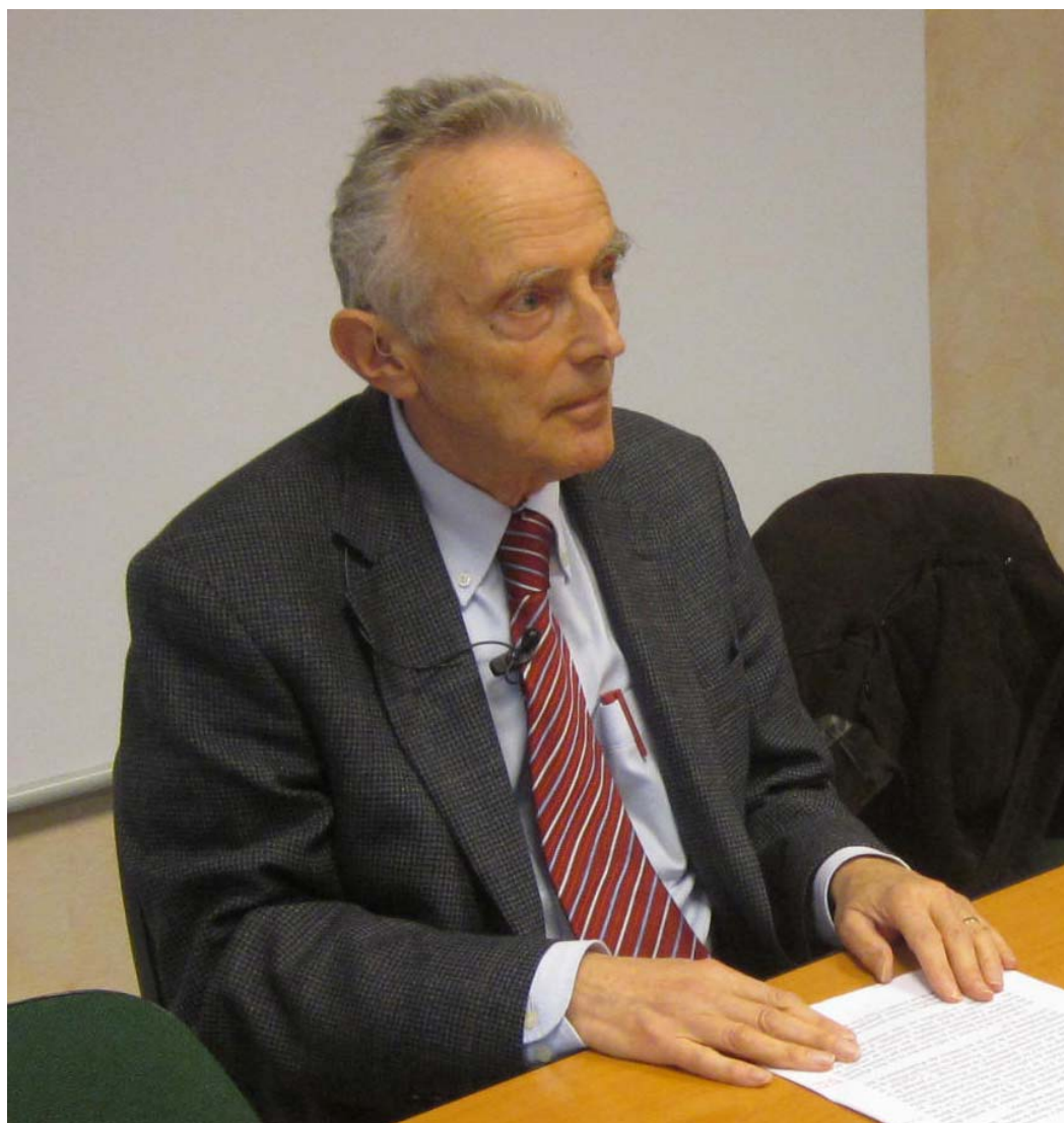
Peter Burke le 4 décembre 2013 à l'Université de Caen Basse-Normandie

Université de Caen Basse-Normandie – CRHQ-UMR 6583, France