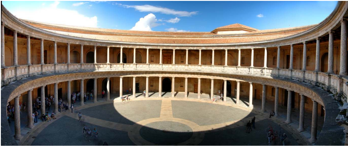
Alhambra : Patio du palais de Charles Quint à Grenade.

aient considéré ce bâtiment comme un exemple de ce que j'appelle un écotype, construit dans le style local andalou, plutôt que comme une construction islamique ou semi-islamique.