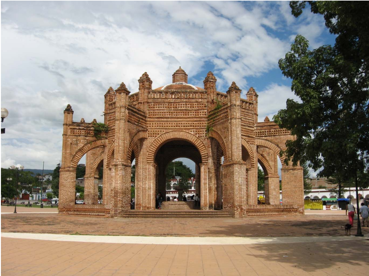
Chiapa : Fontaine de Chiapa de Corzo, Mexique

Pourtant, d'autres bâtiments ont été construits dans ce que les historiens de l'art appellent le style mudéjar – ce qui implique que ce style soit bel et bien regardé comme un écotype –, qui est perçu comme le symbole de l'Andalousie ou même de l'Espagne tout entière. C'est par exemple le cas de la fontaine de Chiapa de Corzo au Mexique.