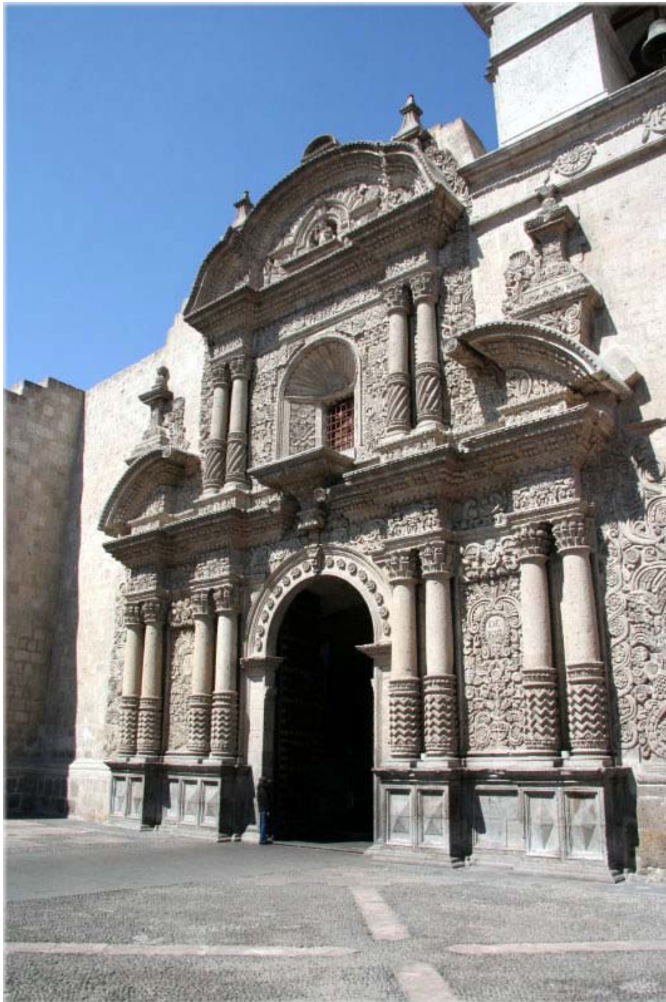
Arequipa : Portail de l'église jésuite d'Arequipa, Pérou.

d'art indigène avant la conquête espagnole 186 . Un célèbre exemple de ce style est l'église jésuite d'Arequipa, connue aujourd'hui sous le nom de la Compañía .