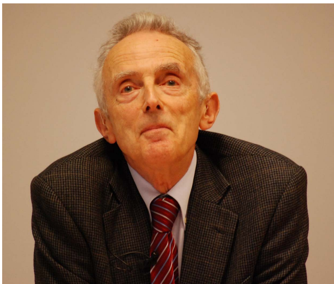
Peter Burke le 4 décembre 2013 à l'Université de Caen Basse-Normandie

Université de Caen Basse-Normandie – CRHQ-UMR 6583, France