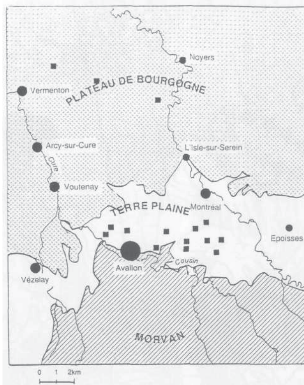
Figure 2. Emplacement des expériences ASPITET dans l'Yonne (le secteur étudié se prolonge en fait vers l'est jusqu'à Semur, en Côte-d'Or)

La démarche appliquée est une démarche typologique où l'on raisonne et échantillonne par « séries de sols » ou « familles pédogéologiques ». Grâce à cet échantillonnage optimisé, se basant sur une excellente connaissance typologique et cartographique des sols, un petit nombre de répétition est suffisant. Chaque « série de sols » ou « famille pédogéologique » est traitée spécifiquement, en particulier quant au nombre et au type d'horizons qui seront prélevés et analysés. L'extrapolation spatiale de la connaissance typologique est possible grâce à l'existence préalable de cartes pédologiques détaillées au 1/50 000.