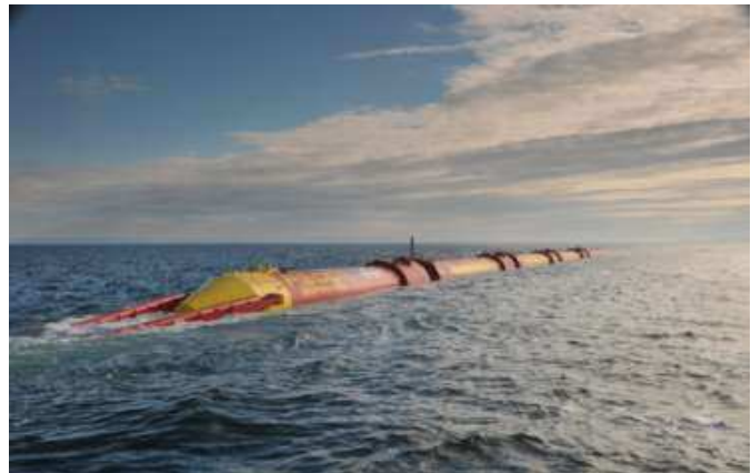
Figure 1 : Le système houlomoteur Pelamis PII en mer

Le projet SEAWATT a pour objectif d'installer une ferme houlomotrice de 30 MW au large de Saint Pierre sur l'île de la Réunion. L'originalité du projet repose sur le volet SEAWATT R&D dont l'objectif est de développer un système de stockage pneumatique de l'énergie pour une ferme de Pelamis PII. Le dimensionnement de ce système nécessite des enregistrements temporels caractéristiques des flux de puissance instantanée. Il est donc nécessaire de se doter d'un simulateur numérique pour obtenir ces flux de puissance. Son développement a été effectué par l'ECN et l'objet de cette publication est de présenter la méthodologie et les résultats obtenus.